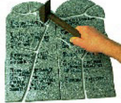
நியாயப்பிரமாணத்தை மீறுவதே பாவம் என்று தேவன் சொல்லுகிறார்.

பதில்: தேவனுடைய பத்துப் பிரமாணங்களை மீறுவதே பாவம். தேவனுடைய பிரமாணங்கள் பூரணமானவைகளாக இருப்பதால் (சங்கீதம் 19:7) அனைத்து பாவத்தையும் அது உள்ளடக்குகிறது. தேவனுடைய பத்துப்பிரமாணங்களுக்கு வெளியே எந்த ஒரு பாவத்தையும் செய்யமுடியாது. “எல்லா மனுஷர்மேலும் விழுந்த கடமை இதுவே”-பிரசங்கி 12:13. எவரும் விடப்படவில்லை.