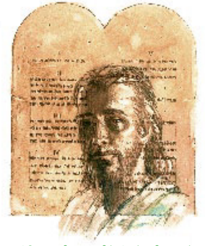
இயேசு மனித உருவில் இருந்த பிரமாணம்; அவர் நமது இருதயத்திற்குள் இருக்கும்போது கற்பனைக்குக் கீழ்ப்படிவது நமக்கு இன்பமாக மாறுகிறது.

பதில்: இல்லவே இல்லை. பிரமாணத்தை அழிக்கிறதற்கு அல்ல மாறாக, அதை நிறைவேற்றவே (கைக்கொள்வே) தாம் வந்ததாக இயேசு குறிப்பாகக் கூறினார். பிரமாணத்தை ஒழிப்பதை விடுத்து, சரியான வாழ்க்கைக்கான பூரண வழிகாட்டியாக இயேசு அதை மேன்மைப்படுத்தினார் (ஏசாயா 42:21). உதாரணமாக, கொலை செய்யாதிருப்பாயாக என்பது காரணமின்றி கோரப்படுகிறதையும் (மத்தேயு 5:21,22), வெறுப்பையும் (1 யோவான் 3:15) கடிந்துகொள்ளுகிறது என்றும், இச்சிப்பதே விபராரத்திற்கு சமம் (மத்தேயு 5:27,28) என்றும் அவர் குறிப்பிட்டார். “நீங்கள் என்னிடத்தில் அன்பாயிருந்தால் என் கற்பனைகளைக் கைக்கொள்ளுங்கள்” (யோவான் 14:15) என்று அவர் கூறுகிறார்.