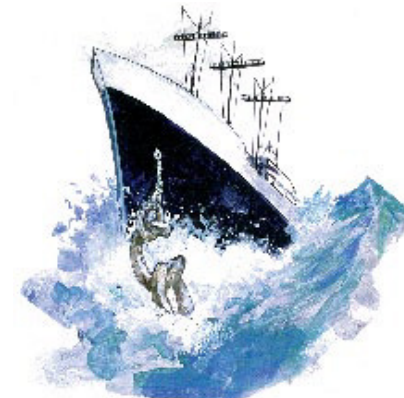
பிரமாணம் ஒரு சங்கிலித்தொடரைப் போன்றது. அதில் ஒரு இணைப்பு அறுந்தாலும் அதன் முழு நோக்கமும் தகர்க்கப்படும்.

பதில்: இரட்சிக்கப்படமாட்டார்கள். அவர்கள் இரட்சிப்பை இழந்துபோவார்கள். தேவனிடத்திற்கும் பரிசுத்தமான வாழ்க்கைக்குமான வழியை கண்டுபிடிக்க நாம் உபயோகிக்கவேண்டிய வழிகாட்டியே பத்துப் பிரமாணங்கள். அதில் ஒரு பிரமாணத்தை நாம் நெகிழ்ந்தாலும், தெய்வீக மாதிரி அல்லது நகலின் ஒரு பகுதியை நிராகரிக்கிறோம். சங்கிலியின் ஒரு இணைப்பு அறுந்தாலும் அதன் முழு நோக்கமும் வீணாகிவிடும். தேவனுடைய கட்டளைகளில் ஒன்றை அறிந்து மீறும்போது நாம் பாவம் செய்கிறதாக (யாக்கோபு 4:17) வேதாகமம் சொல்லுகிறது. ஏனெனில் நமக்கான அவருடைய திட்டத்தை நாம் நிராகரிக்கிறோம். அவருடைய சித்தத்தை செய்கிறவர்கள் மாத்திரமே பரலோக இராஜ்யத்திற்குள் பிரவேசிக்கமுடியும். பாவினர் இரட்சிப்பை இழந்துபோவார்கள்.