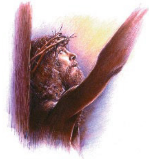
பிரமாணம் மாற்றப்படக்கூடாது என்பதை சிலுவை நிரூபிக்கிறது.

பதில்: கூடவே கூடாது. வேதாகமம் இந்தக் கருத்தில் மிகத் தெளிவாக இருக்கிறது. மாற்றப்படக்கூடுமானால், ஆதாரமும் ஏவாளும் பாவம் செய்தவுடனேயே, மீறப்பட்ட பிரமாணத்தின் தண்டனையை சுமக்கும்படி தமது குமாரனை மரிக்க அனுப்புவதற்குப்பதிலாக, அவர் பிரமாணத்தில் மாற்றங்கள் செய்திருப்பார். ஆனால் இது கூடாதகாரியம். ஏனெனில் அவ்வப்போது இணைக்கப்படுகிற சட்டங்களையும் ஒழுங்கு களையும் கொண்டதல்ல கற்பனைகள். உண்மையில்