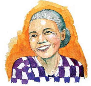
இயேசு இருதயத்தில் வாழும்போது இருண்ட அழுக்கான கடந்தகாலம் அவருடைய வெற்றிகரமான வாழ்க்கையினால் மாற்றியமைக்கப்படுகிறது.

பதில்: கிறிஸ்து மனந்திரும்பின பாவினை மன்னிப்பது மாத்ரிமல்ல, அவர்களில் தேவனுடைய சாயலை புதுப்பிக்கவும் செய்கிறார். உள்ளே தங்கியிருக்கும் அவருடைய சமூகத்தின் வல்லமையினால் தம்முடைய பிரமாணத்திற்கு இசைவாக அவர்களைக் கொண்டுவருகிறார். “செய்யாதிருப்பாயாக” என்ற கற்பனைகள், இயேசு உள்ளே வசித்திருந்து கட்டுப்படுத்துவதால் வாக்குறுதிகளாக மாறுகிறது. தேவனால் தமது பிரமாணத்தை மாற்றமுடியாது. அதினால் பாவியை இயேசுவின் வழியாக தம்முடைய பிரமாணத்திற்கு இசைவாக மாற்றிக்கொண்டுவர ஆசீர்வாதமான ஒரு ஏற்பாட்டை அவர் செய்திருக்கிறார்.