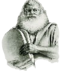
அந்த கற்பலகைகள் தேவனுடைய வேலையாயிருந்தது.