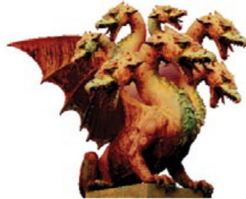
வலுசர்ப்பம் ஸ்திரிபின்மேல் கோபங்கொண்டது.

பதில்: பிரமாணம் சரியான வாழ்க்கைக்கான மாதிரியாகையால், தேவனுடைய பிரமாணங்களை உயர்த்திப்பிடிக்கிறவர்களை பிசாசு கசப்பாக வெறுக்கிறான் என்பதில் ஆச்சரியப்படுவதற்கு ஒன்றுமில்லை. தேவனுடைய பிரமாணத்தில் கொடுக்கப்பட்டுள்ள மாதிரியை பின்பற்ற தீர்மானிக்கும் போதுதானே பிசாசின் சீற்றமான கோபத்தை நீங்கள் உணரலாம். ஆனால் தேவனுடைய பத்துக் கற்பனைகளின் கட்டுப்படுத்தும் கோரிக்கைகளை மறுதலித்து, அதேநேரம் மனிதருடைய பாரம்பரியங்களை உயர்த்திப்பிடிக்கிற மதத் தலைவர்களைக்குறித்து கேட்பதுதான் அதிர்ச்சியூட்டுகிறது. “நீங்கள் உங்கள் பாரம்பரியத்தினாலே தேவனுடைய கற்பனையை ஏன் மீறி நடக்கிறீர்கள்?” “மனுஷருடைய கற்பனைகளை உபதேசங்களாகப் போதித்து, வீணாய் எனக்கு ஆராதனை செய்கிறார்கள்” (மத். 15:3,9) என்று இயேசு கூறியதில் ஆச்சரியம் எதுவுமில்லை. “நீதியைச் செய்யச் சுட்டருக்கு வேளைவந்தது; அவர்கள் உம்முடைய நியாயப்பிரமாணத்தை மீறினார்கள்” (சங். 119:126) என்று தாவீது கூறினான். கிறிஸ்தவர்கள் விழித்து தேவனுடைய பிரமாணத்தை அதனுடைய சரியான உயர்த்தப்பட்ட இடத்தில் திரும்பவும் வைக்கவேண்டும். ஜீவனுள்ள தேவனுடைய கற்பனைகளை தண்டனையின்றி மீறலாம் என்று யூகித்துக் கொள்ளுவது கண்டிப்பில்லாத தலைமுறையின் மதியீனம்.