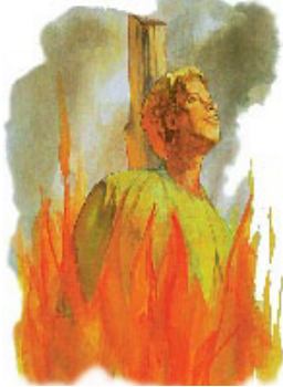
இருண்ட யுகத்தில் இலட்சக்கணக்கான கிறிஸ்தவர்கள் மரித்தனர். அநேகர் கமுரத்தில் எரிக்கப்பட்டனர்.)

நிறைவேறுதல்: இருண்ட காலத்தில் தேவதுரோகம் செய்த சபையினால் துவங்கப்பட்ட நீண்ட உபத்திரவ காலத்தை இந்தத் தீர்க்கதரிசனம் முதலாவது சுட்டிக்காட்டுகிறது. அது ஆயிரம் வருடங்களுக்கும் மேலாக தொடர்ந்தது. ஏறக்குறைய ஐந்து கோடி கிறிஸ்தவர்கள் தங்கள் விசுவாசத்திற்காக அந்த பயங்கரமான உபத்திரவ காலத்தில் கொல்லப்பட்டனர். “மனிதக் குலத்தில் இதுவரையிலும் இருந்திருந்த வேறு எந்த நிருவனத்தைக் காட்டிலும் (தேவ துரோகம் செய்த சபை) அதிகமான குற்றமில்லாத இரத்தத்தைச்