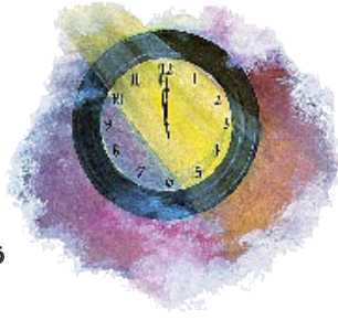
நாம் காலத்தின் கடைசி மணித்துளிகளில் வாழ்ந்து கொண்டிருக்கிறோம்.

“அத்திரத்தினால் ஒரு உவமையைக் கற்றுக்கொள்ளுங்கள்; அதிலே இளங்கிளை தோன்றி, துளிர்விடும்போது, வசந்த காலம் சமீபமாயிற்று என்று அறிவீர்கள். அப்படியே இவைகளை யெல்லாம் நீங்கள் காணும்போது, அவர் சமீபமாய் வாசலருகே வந்திருக்கிறார் என்று அறியுங்கள். இவைகளெல்லாம் சம்பவிக்கு முன்னே இந்தச் சந்ததி ஒழிந்து போகாதென்று, மெய்யாகவே உங்களுக்குச் சொல்லுகிறேன்”- மத்தேயு 24:32-34.