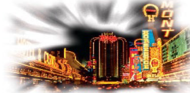
கடைசிகால மக்களில் அநேகர் தேவனைவிடவும் இன்பங்களை அதிகம் நேசிப்பார்கள்

பூமியதிர்ச்சிகளும், சுழல்காற்றுகளும், வெள்ளங்களும் முன்னெப்போதும் இல்லாதளவு அதிகரித்துக்கொண்டிருக்கின்றன. உலகத்தின் முன்றிலொரு பகுதியினர் பசியோடிருக்கிறார்கள். ஆயிரக்கணக்கானோர் அனுதினமும் பட்டினியால் சாகிறார்கள். இவைகள் அனைத்தும் நாம் பூமியின் கடைசி மணிநேரங்களில் வாழ்ந்து