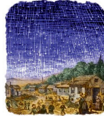
நட்சத்திர விழுகை நவம்பர் 13, 1833ல் நடந்தது.

ஒரு செய்தித்தாளை தெருவில் நின்று வாசிக்குமளவு அது பிரகாசமாயிருந்தது. ஒரு எழுத்தாளர்: “ஏறக்குறைய நான்கு மணி நேரங்கள் வானம் பிரகாசமாயிருந்தது” என்கிறார். உலகத்தின் முடிவு வந்துவிட்டது என்று மனிதர் நினைத்தனர். கண்களை மிகவும் கவரும் இயேசுவின் இரண்டாம் வருகைக்கான இவ்வடையாளங்களைச் சிந்தியுங்கள்.