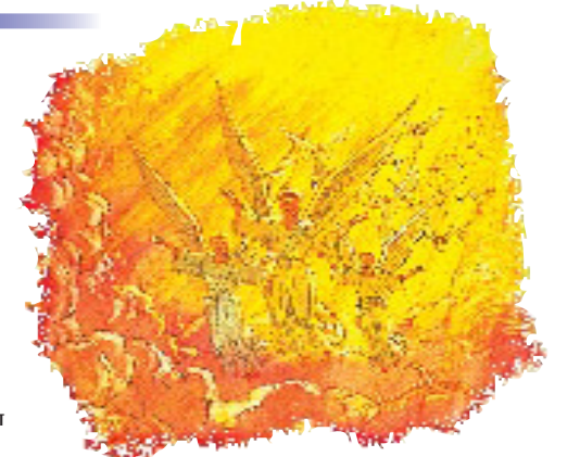
இயேசுவின் இரண்டாம் வருகையில் பரலோகத்திலிருக்கிற அனைத்து தூதர்களும் அவரோடு வருவார்கள்.

பதில்: பரலோகத்தின் அனைத்து தூதர்களும் இயேசுவின் இரண்டாம் வருகையில் அவரோடுகூட வருவார்கள். பூமியை நெருங்கும்போது இயேசு தமது தூதர்களை அனுப்புவார். பரலோகத்திற்குத் திரும்பிச்செல்லும் பயணத்திற்கு ஆயத்தமாயிருந்த நீதிமான்கள் அனைவரையும் அவர்கள் சேர்ப்பார்கள்.