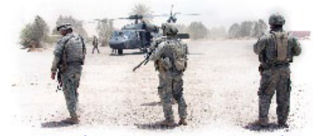
நாடுகளுக்கிடையேயான சச்சரவுகள் இயேசுவின் இரண்டாம் வருகைக்கான ஒரு அடையாளம்.

யுத்தங்களும் பொது அழிவுகளும் உலகம் முழுவதும் ஆயிரக்கணக்கானோரை பாதித்துக் கொண்டிருக்கிறது. இயேசுவின் அதிசீக்கிர வருகையே யுத்தத்தின் வேதனையையும் அழிவையும் முடிவிற்குக் கொண்டுவரும்.