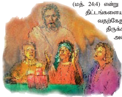
மற்றவர்களைப்போன்று ஆள்மாறாட்டம் செய்கிற பிசாசுகளில் ஒன்றே இயேசுவைப்போன்று தோற்றம் அளிக்கிறது.

அவர் வனாந்தரத்திலோ அல்லது அறைவிட்டிலோ காணப்படமாட்டார் என்றார். கிறிஸ்துவின் இரண்டாம் வருகையைக் குறித்து வேதாகமம் போதிக் கிறதை நாம் கற்றுக்கொள்வோ மானால் வஞ்சிக்கப்படமாட்டோம். அதைக் குறித்து வேதாகமம் என்ன சொல்லுகிறது என்கிற அமில பரிசோதனையே நீங்கள் செய்யவேண்டிய ஒன்று. இரண்டாம் வருகையைக் குறித்து வேதாகமம் என்ன சொல்லுகிறது என்று அறிந்திருக்கிற மக்கள் சாத்தானால் வஞ்சிக்கப்படமுடியாது; மற்ற அனைவரும் வஞ்சிக்கப்படுவார்கள்.