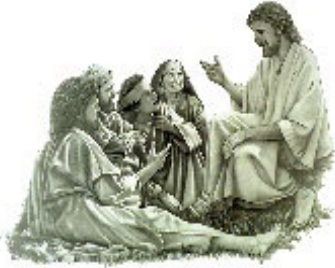
இரண்டாவது முறை பூமிக்குத் திரும்ப வருவேன் என்று இயேசு போதித்தார்.

(யோவான் 10:35), இது மிக சாதகமான ஆதாரம். இது எவ்விதம் சொல்லுகிறதோ அவ்விதமே நம்புங்கள். இது கிறிஸ்துவினுடைய உத்திரவாதம்.