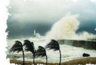
எதிர்காலத்தைக் குறித்த பயமும் அச்சமும் இயேசுவின் இரண்டாம் வருகைக்கான ஒரு அடையாளம்.

“பூமியின்மேலுள்ள ஜனங்களுக்குத் தத்தளிப்பும் இடுக்கணும் உண்டாகும்;... பூமியின்மேல் வரும் ஆபத்துகளுக்குப் பயந்து எதிர்பார்த்திருக்கிறதினால் மனுஷருடைய இருதயம் சோர்ந்துபோம்”-லூக்கா 21:25,26.