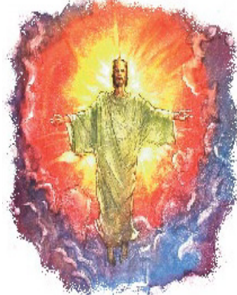
மேகங்கள்மேல் பூமிக்குத் திரும்புவதாக இயேசு கூறினார்.

பதில்: ஆமாம். இயேசு பூமிக்கு மீண்டும் திரும்ப வரப்போகிறதை ஒரு ஆணையோடே உறுதிப்படுத்தினார். (மத்தேயு 26:64). வேதவாக்கியம் தவறாததாயிருப்பதால்