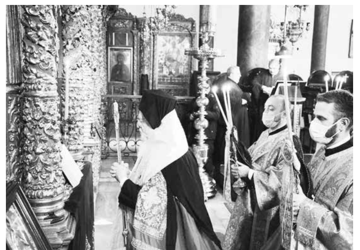
Ο Οικουμενικός Πατριάρχης Βαρθολομαίος ψάλλει τον Ακάθιστο Ύμνο μπροστά στην εικόνα της Υπεραγίας Θεοτόκου.

κ. Παΐσιο, μέχρι πρότινος Διευθυντή του Ιδιαίτερου Πατριαρχικού Γραφείου.