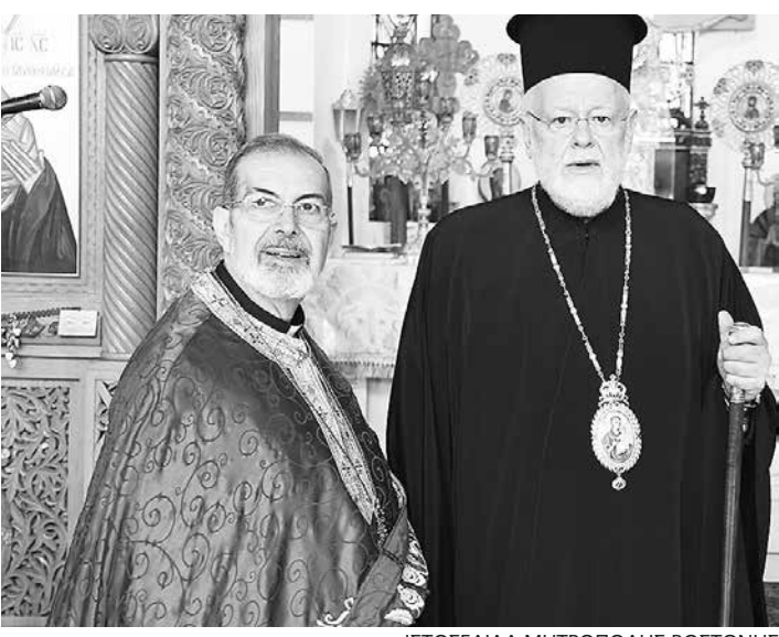
ΙΣΤΟΣΕΛΙΔΑ ΜΗΤΡΟΠΟΛΗΣ ΒΟΣΤΩΝΗΣ

Περί τις δύο χιλιάδες πιστοί όλων των γενεών και ηλικιών είχαν κατακλύσει τον ναό από νωρίς το πρωί, ενώ αστυνομικές