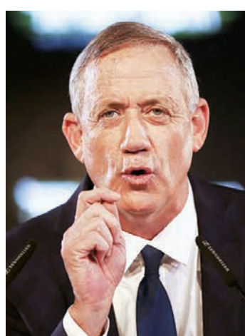
ΑΣΟΣΙΕΙΤΕΝ ΠΡΕΣ Ο Μπένι Γκαντς.

Επίσης, η Elbit θα παρέχει υλικά για την αναβάθμιση και τη λειτουργία των μαχητικών αεροσκαφών T-6 της Ελληνικής Πολεμικής Αεροπορίας, καθώς και εκπαίδευ-