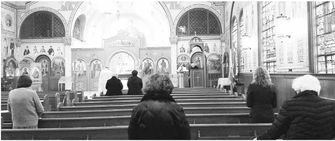
Η Ακολουθία του Ακαθίστου Ύμνου στον ιερό ναό του Αγ. Δημητρίου στην πόλη Περθ ΑμποΪ.

Ψάλλεται τμηματικά το βράδυ της Παρασκευής των τεσσαράντων πρώτων εβδομάδων των Νηστειών και ολόκληρο το βράδυ της Παρασκευής της πέμπτης εβδο-