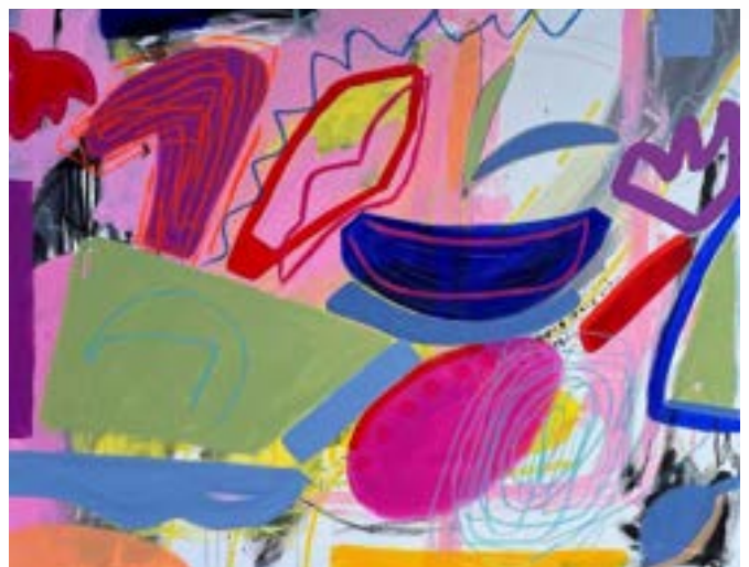
ТАНЯ ЛИТКО Таня Литко