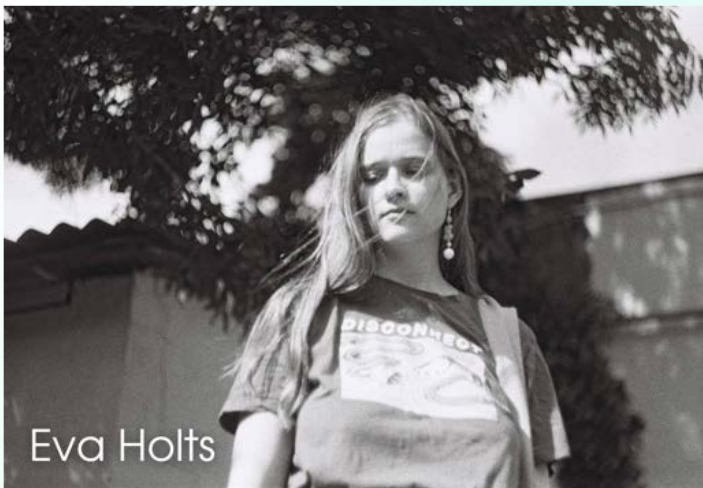
ЄВА ГОЛЬЦ Eva Holts

Єва Гольц – українська фотографиня, мисткиня. Створює альтернативний світ для своїх персонажів. Прості розмальовані декорації для підкреслення нереальності ситуацій. Або ж інтегрує їх у повсякдення, натякаючи на те, що світ не очевидний і наповнений секретами.