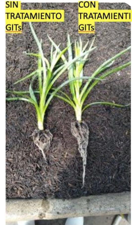
Esquejes enraizamientos 21 días