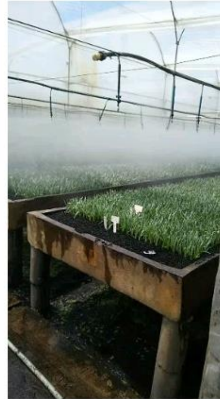
Esquejes clavel oct 2021