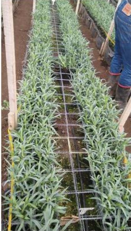
Plantas clavel 12 semanas