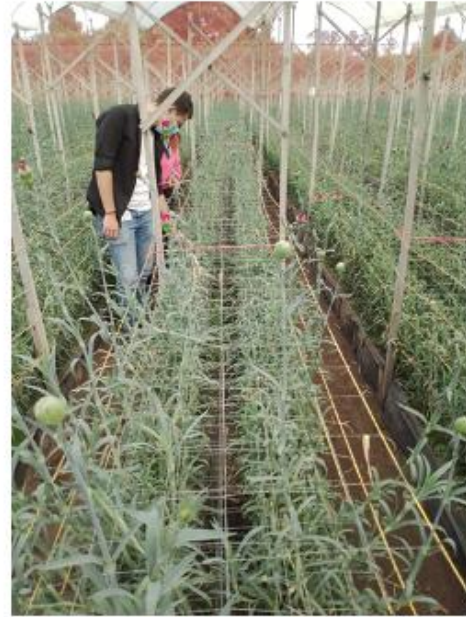
Plantas clavel 24 semanas – ya en producción. Clavel tratados con GREEN