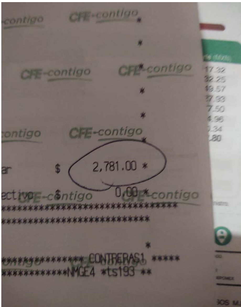
Recibo de luz bimestral