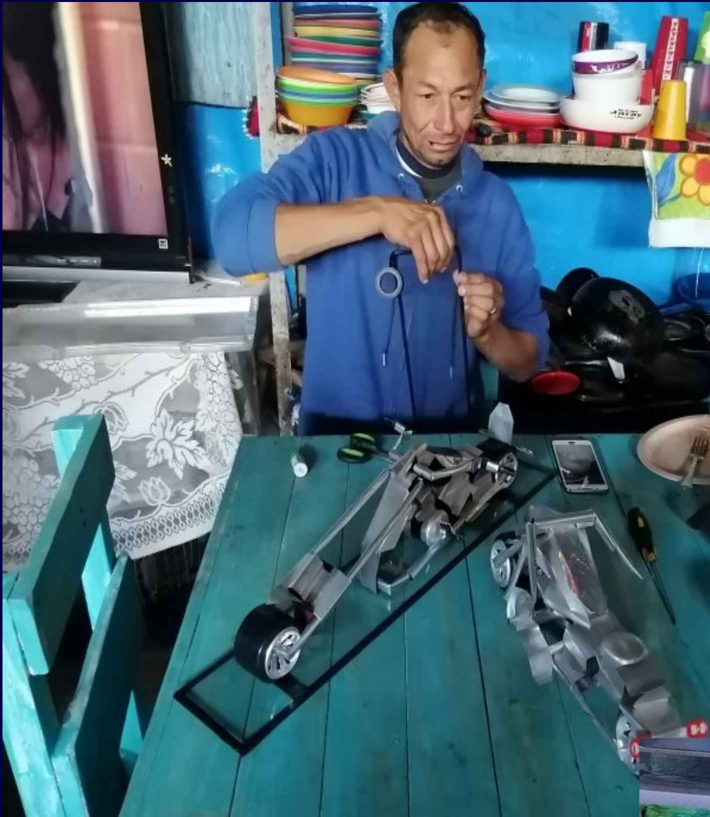
Coches con latas recicladas