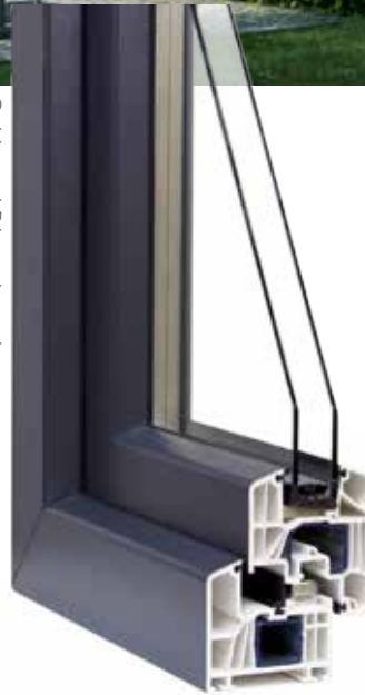
Caldo met Strato-vleugel