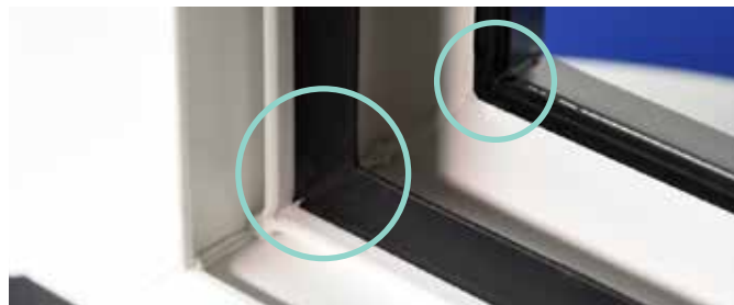
Fig. 2: Alle dichtingen of rubbers worden samen met het pvc-profiel geëxtrudeerd. Bij het samenstellen van de profielen tot een raam worden de rubbers mee gelast. Resultaat: perfecte wind- en waterdichtheid!