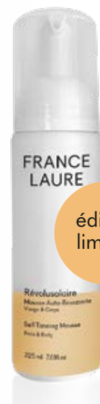
MOUSSE AUTO-BRONZANTE visage & corps

Format: 200ml Code produit: 101523 PRIX: 40,00