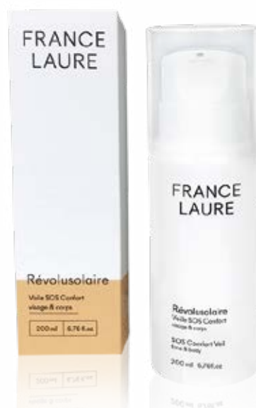
VOILE SOS CONFORT visage & corps protéger

Format: 200ml Code produit: 101522 PRIX: 57,90