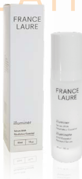
SÉRUM AHA RÉVÉLATEUR ESSENTIEL illuminer

Format: 250ml Code produit: 708012 PRIX: 94,60