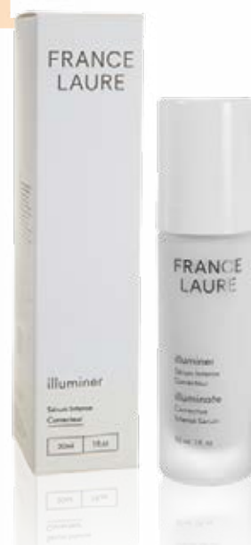
SÉRUM INTENSE CORRECTEUR illuminer

Format: 30ml Code produit: 708022 PRIX: 84,10