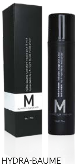
HYDRA-BAUME VISAGE M | au masculin

Format: 520ml Code produit: 707012 PRIX: 47,20