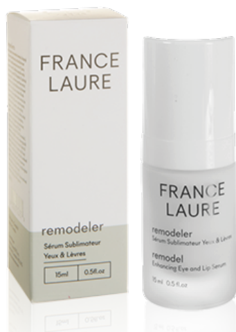
SÉRUM SUBLIMATEUR YEUX & LÈVRES remodeler

Format: 15g Code produit: 303020 PRIX: 63,00