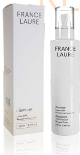
LOTION AHA RÉVÉLATRICE ESSENTIELLE illuminer

Cette lotion à l'agréable odeur de fruits d'été s'utilise en cure. Combinée avec le Sérum AHA Révélateur Essentiel, elle stimule le renouvellement épithélial et offre une exfoliation graduelle à la peau. Combinée avec le Sérum Intense Correcteur, elle éclaircit et unifie le teint.