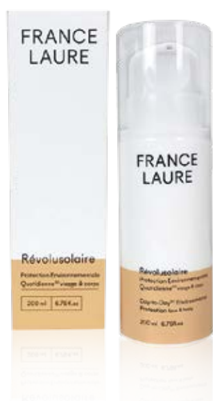
PROTECTION ENVIRONNEMENTALE QUOTIDIENNE 30 visage & corps protéger

Protège des agressions environnementales, maintient la balance hydrolipidique et combat le photo-vieillessement. Sans parfum, hypoallergénique.