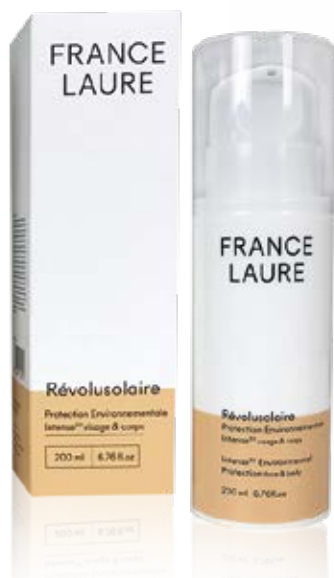
PROTECTION ENVIRONNEMENTALE INTENSE 50 visage & corps

Format: 200ml Code produit: 101521 PRIX: 55,10