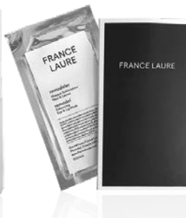
MASQUE SUBLIMATEUR YEUX & LÈVRES remodeler

Format: 15ml Code produit: 303021 PRIX: 63,00