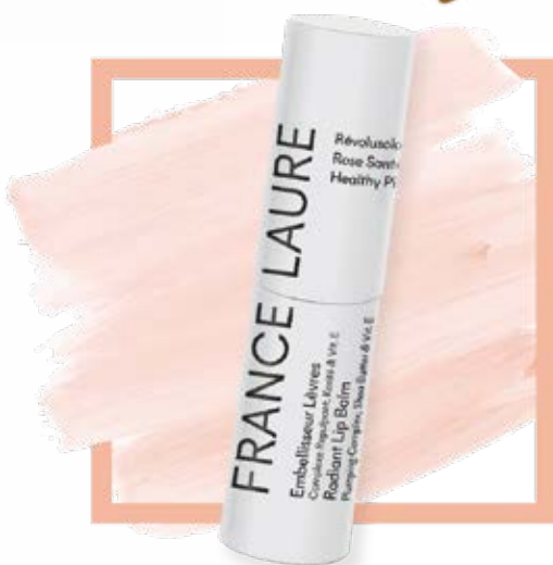
EMBELLISSEUR LÈVRES rose santé RÉVOLUSOLAIRE 10 protéger

Format: 15g Code produit: rose-beige 101501 Code produit: beige foncé 101502 PRIX: 42,00 ch.