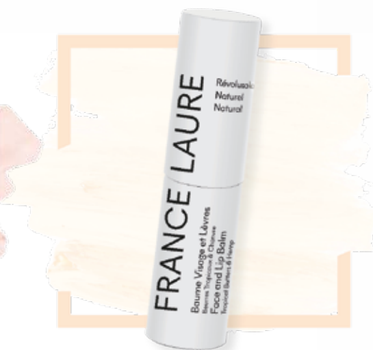
BAUME VISAGE ET LÈVRES naturel RÉVOLUSOLAIRE 10

Format: 10g Code produit: 101505 PRIX: 20,00