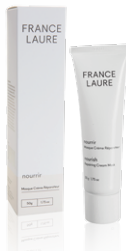
MASQUE CRÈME RÉPARATEUR nourrir

Format: 50g Code produit: 105022 PRIX: 63,00