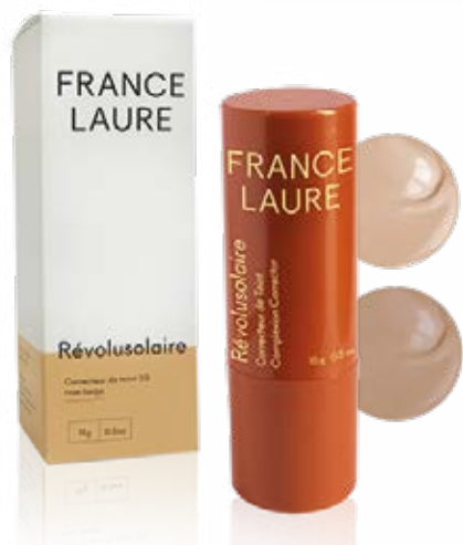
CORRECTEUR DE TEINT 30 ROSE-BEIGE OU BEIGE FONCÉ protéger

Protège des agressions extérieures et lutte contre le vieillissement prématuré de la peau. Masque les imperfections. Laisse un fini poudreux, sans résidus sur la peau. Hypoallergénique, résistant à l'eau et à la sueur. Offert en deux tons, rose-beige et beige foncé