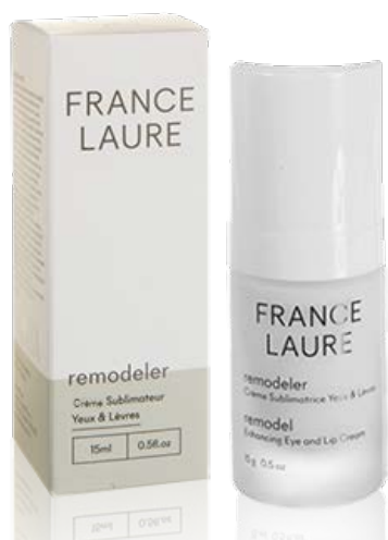
CRÈME SUBLIMATRICE YEUX & LÈVRES remodeler

Cette crème hydrate, adoucit et prévient les rides. Elle traite cette région fragile qu'est le contour des yeux et des lèvres.