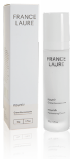
CRÈME HARMONISANTE nourrir

Une collection hivernale idéale pour tous les membres de la famille.