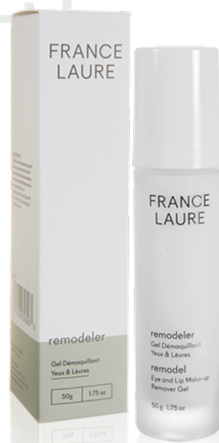
GEL DÉMAQUILLANT YEUX & LÈVRES remodeler

Format: x2 Code produit: 303024 PRIX: 16,00