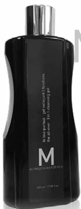
GEL DOUCHE TOUT-PARTOUT M | au masculin

Ce gel douche tout-en-un pour le visage, le corps et le rasage, élimine les impuretés, oxygène la peau et équilibre le pH cutané.