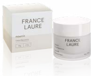
CRÈME RÉPARATRICE nourrir

Format: 50g Code produit: 104072 PRIX: 52,60