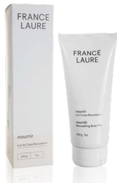
LAIT CORPS REMODELANT nourrir

Format: 50g Code produit: 113042 PRIX: 73,60