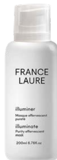
MASQUE EFFERVESCENT PURETÉ illuminer

Petit miracle aux actions multiples, ce masque oxygène, éclaircit, purifie et normalise les sécrétions sébacées. Il réduit l'apparence des rides, des signes de vieillissement et stimule la production de collagène.