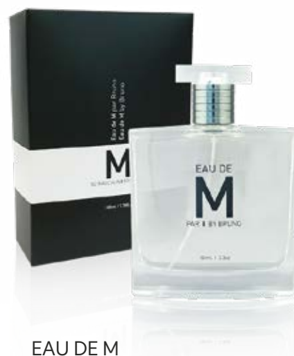
EAU DE M PAR BRUNO M | au masculin

Format: 50g Code produit: 707060 PRIX: 36,80