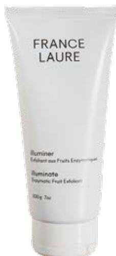
EXFOLIANT AUX FRUITS ENZYMATIQUES illuminer

Cet exfoliant enzymatique agit sans frictionner la peau. Il revitalise, resserre les pores et améliore l'apparence des taches. Il est idéal pour une utilisation sous la douche, son action est renforcée avec la vapeur.