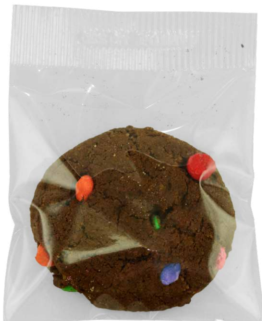
443-U15 Cookies de chocolate com confetes Pacote 15g ( 1 unidade por pacote) EAN 789627450443-5