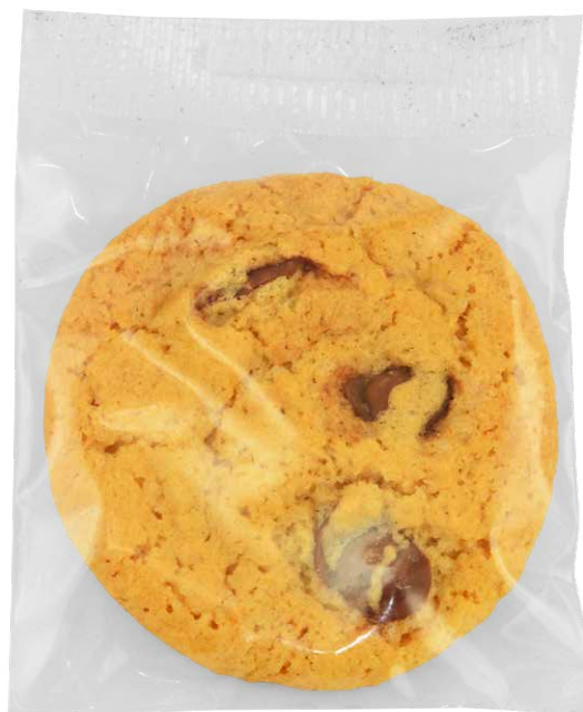
447-U15 Cookies de baunilha com gotas de chocolate Pacote 15g ( 1 unidade por pacote) EAN 789627450447-3