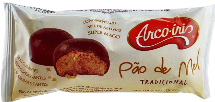
309-U20 Pão de Mel Tradicional com cobertura sabor chocolate ao leite Pacote 20g - 2 unidades EAN 789627450309-4 Caixa 60: DUN 1-789627450309-1 Caixa 180: DUN 8-789627450309-0 Caixa 400: DUN 9-789627450309-7