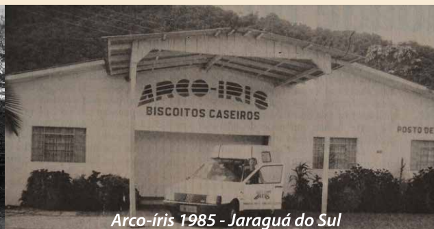
Arco-íris 1985 - Jaraguá do Sul