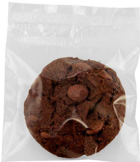
448-U15 Cookies de cacau com gotas de chocolate Pacote 15g ( 1 unidade por pacote) EAN 789627450448-0