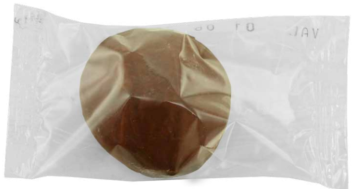
442-U10 Pão de Mel Tradicional com cobertura sabor chocolate ao leite Pacote 10g - 1 unidade EAN 789627450442-8