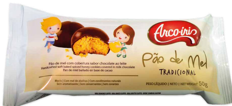
330-U50 Pão de Mel Tradicional com cobertura sabor chocolate ao leite Pacote 50g - 5 unidades EAN 789627450330-8 Caixa 50: DUN 7-789627450330-7 Caixa 135: DUN 9-789627450330-1

Consulte-nos: contato@arcoirisespecialidades.com Telefone e WhastApp: 47 47 3370-8255 www.arcoirisespecialidades.com