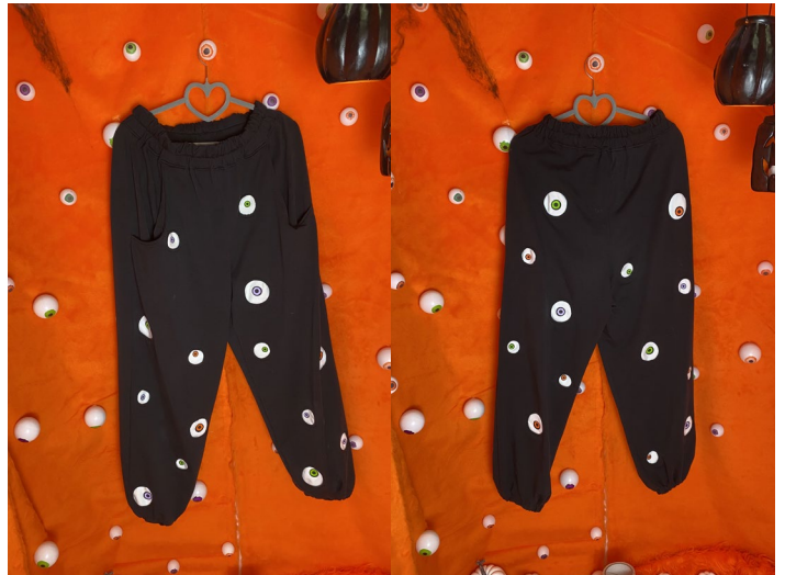
All eyes on me