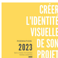
Créer l'identité visuelle de votre projet