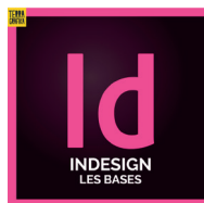
Indesign Les bases