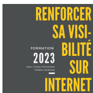
Renforcer sa visibilité sur internet