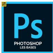
Photoshop Les bases