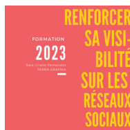
Renforcer sa visibilité sur les réseaux sociaux

Pour en savoir plus consulter terragrafika.fr/formations