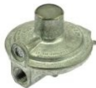
REGULADOR DE GAS ENTRADE DE 1/4" X 3/8" SALIDA