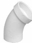
CODO CALLE DE 45 GRADOS