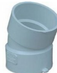
CODO DE 22-1/2 GRADOS