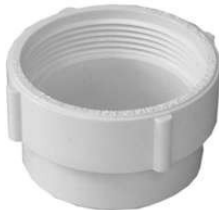
ADAPTADOR PARA REGISTRO