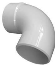
CODO CALLE DE 90 GRADOS