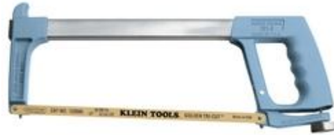
ARCO PARA SEGUETA CON SEGUETA