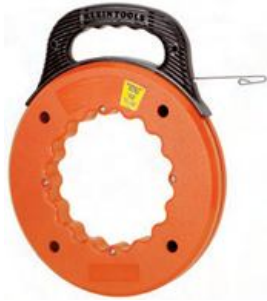
GUIA PARA ELECTRICISTA