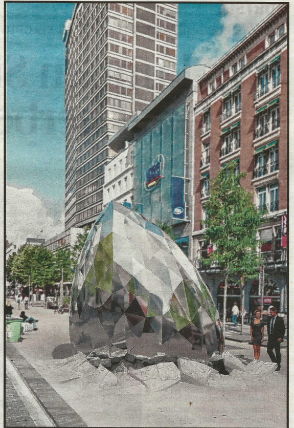
Voorstel 1: een diamant die vanuit de trottoirstenen naar buiten barst.