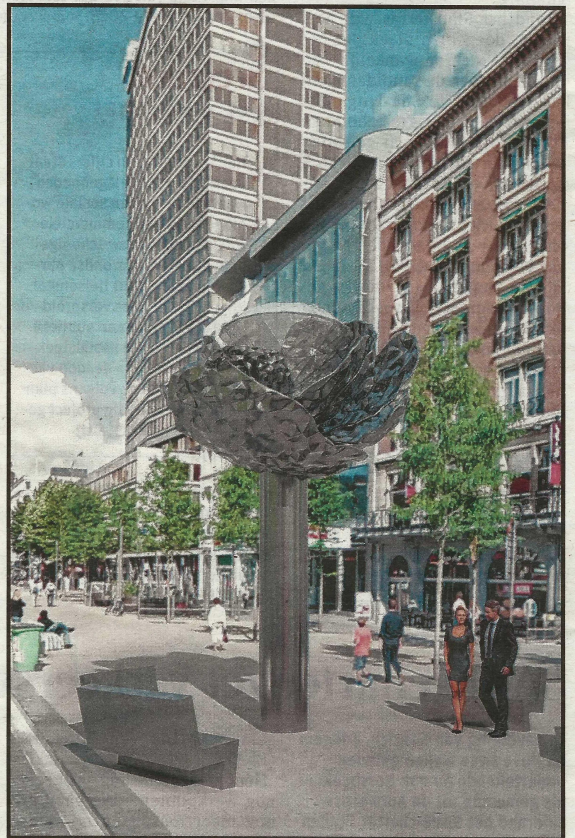
Voorstel 2: een bloemstengel waaruit een diamant groeit.