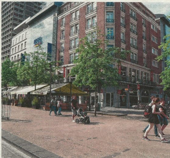
In oktober 2017 moest op het brede voetpad van de De Keyserlei, aan het kruispunt met de Anneessensstraat en de Appelmansstraat, het monument onthuld worden. FOTO JAN VAN DER PERRE

Ook bij AWDC is het plan niet zomaar van de tafel geveegd. "Het budget is er nog. Wij wachten op een nieuw initiatief van de stad", zegt Margaux Donckier. PATRICK VINCENT