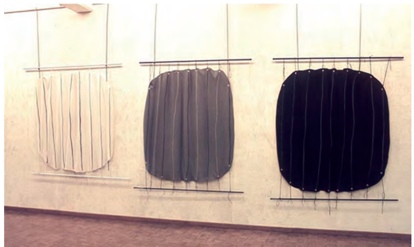
▲ Wit, Grijs en Zwart uit de reeks ‘Afgeronde Vierkanten’; krijt op feuter (vilt).

Wat hij had gezien op Expo 58 was hij niet vergeten. “En ik was na de Praagse Lente ook geïnteresseerd in de politieke ontwikkelingen in Tsjecho-Slowakije.” Naast schilderkunst hield hij zich in Praag bezig met lithografie. In 1979 ontving hij een navorsingsbeurs, opnieuw in Praag, maar ditmaal aan de Academie voor Toegepaste Kunsten voor een studie ‘Glazen Receptiënten’.