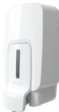
1.000 ML - WHITE/WHITE E203101-1000