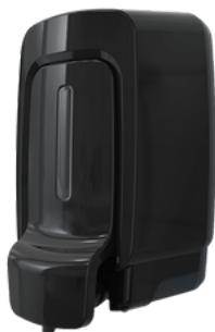
500 ML - BLACK/BLACK E203102-500