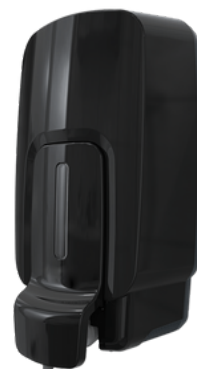
1.000 ML - BLACK/BLACK E203102-1000