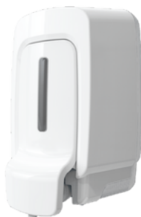
500 ML - WHITE/WHITE E203101-500