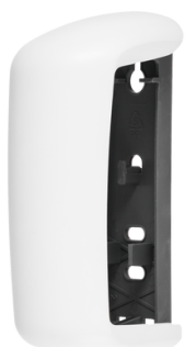
CLEAN WHITE E102101