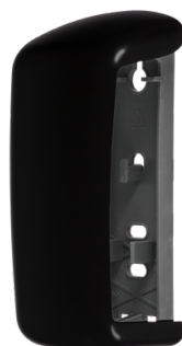
MODERN BLACK E102102