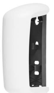
CLEAN WHITE E102101