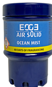
OCEAN MIST E102203