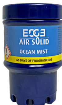
OCEAN MIST ET02203