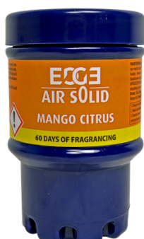
MANGO CITRUS ET02201