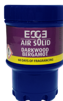
DARKWOOD BERGAMOT ET02204