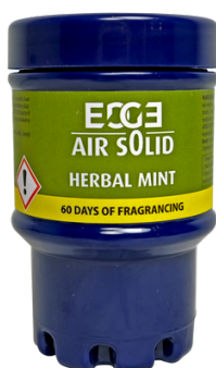
HERBAL MINT ET02202