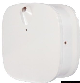
CLEAN WHITE E105101