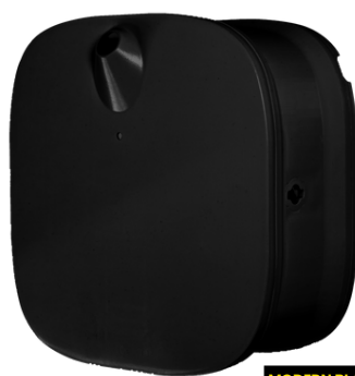
MODERN BLACK E105102