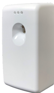
CLEAN WHITE E110101