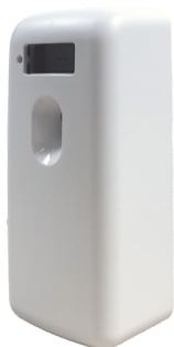
CLEAN WHITE E111101