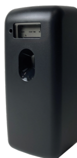
MODERN BLACK E111102