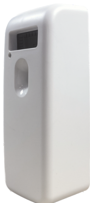
CLEAN WHITE E121101