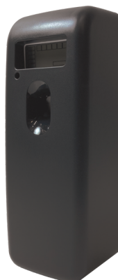
MODERN BLACK E121102