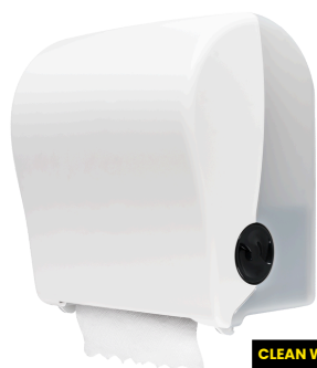
CLEAN WHITE E301101