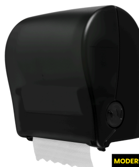
MODERN BLACK E301102