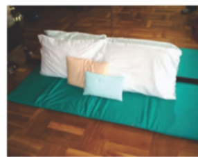
Kit de PPO