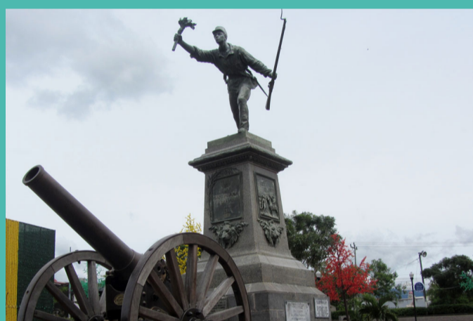
1. LE MONUMENT JUAN SANTAMARIA