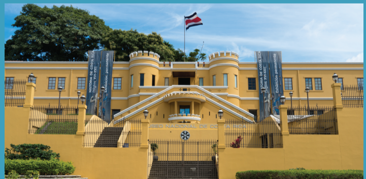
5. MUSÉE NATIONAL