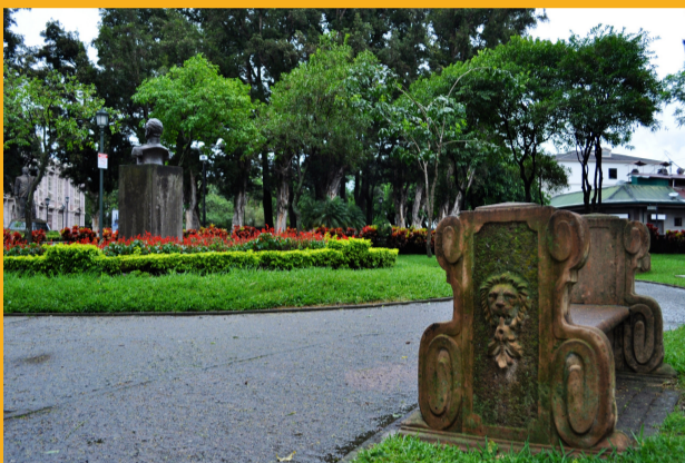
1. PARQUE DE LA PAIX