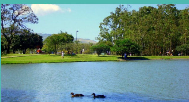
3. PARQUE LA SABANA