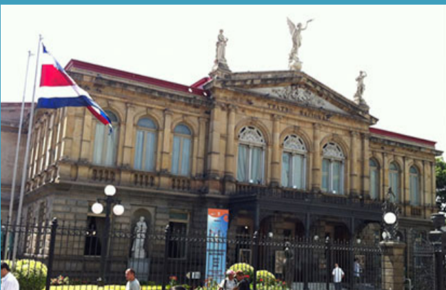
4. THÉÂTRE NATIONAL