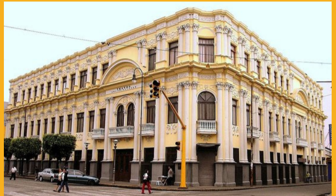
1. TÉÂTRE MÉLICO SALAZAR