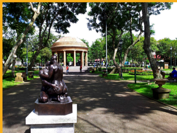
2. PARQUE MORAZÁN