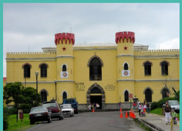
3. MUSÉE DES ENFANTS