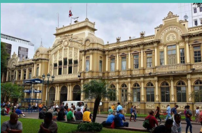
2. LE COURRIER