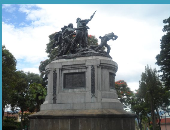
2. LE MONUMENT NATIONAL