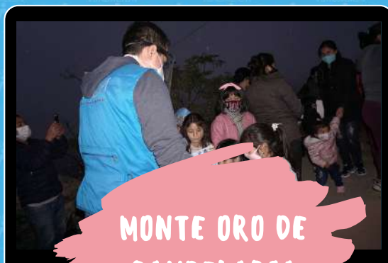
MONTE ORO DE CANDELARIA