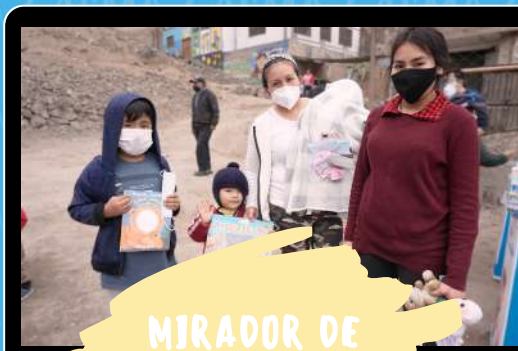
MIRADOR DE VILLA