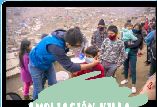
AMPLIACIÓN VILLA HERMOSA