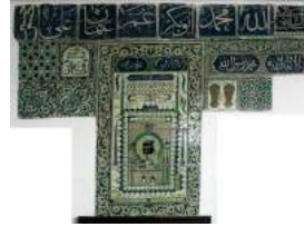
Fotoğraf no: 1 Küre Hoca Şemseddin Camii Mihrap Duvarı ve çinileri

Genel olarak T şeklinde yerleştirilmiş çiniler, çeşitli boyutta ve desene sahip toplamda 39 adet plakadan oluşmaktadır. Panonun toplam ölçüsü 150 x 210 cm.dir. Çinilerin merkezinde 8 adet büyük dikdörtgen karoyu, 14 adet küçük dikdörtgenin çerçevelediği Kâbe tasvirli pano yer almaktadır. Kâbe tasvirli panonun sağında 3 adet plakadan oluşan “Kelime-i Tevhid Yazılı” bir pano ve bu panonun altında “Na-ı Şerif” dekorlu bir plaka ile “geometrik desenli” bir plaka; Kâbe Tasvirli Panonun solunda, ulama desenli birbiri ile aynı iki plaka ve bunların üstünde yer alan, “El Halak- El Baki” yazılı tek plakadan oluşan bir pano ile geometrik desenli bir plaka; bütün plakaların uzunluğunda en üstte ise kobalt zemin boyalı 8 adet plaka yer almaktadır.