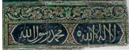
Fotoğraf no: 4 "Kelime-i Tevhid" yazılı pano "Kelime-i Tevhid" yazılı pano: (bakınız çizim: 2, plaka no: 13- 15).

Küre Akşemseddin camii'nde bulunan Nal-ı Şerif pano üzerinde: "Haz. Nali-i Aleyhisselam/ Sahib El Hayrat Hüseyin Çelebi/ İlahi Şefaatin Eyle Müyesser/ Amin Bi Hürmeti Seyyid El Mürselin Sene 1087" yazıları vardır. 13 Sarı sandaletlerin üzerinde oldukça kabarık kırmızı ile noktalar yapılmıştır.