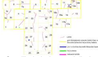
Çizim no: 2, Hoca Şemseddin Camii'nde bulunan çinilerin numaralandırılması ve durum tespiti.

Yazılar zeminin kobalt mavi ile doldurulması ile oluşturulmuştur. Sağdan birinci ve beşinci plakanın altında geometrik bordür deseni görülmektedir. Sağdan sola: El Halak- El Baki, Allah (c.c), Muhammed (s.a.v), Ebu Bekir, Ömer, Osman, Ali, Hasan Hüseyin yazmaktadır.