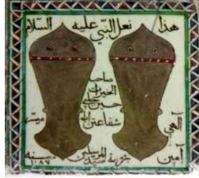
Fotoğraf no: 3 Nal-ı Şerif Pano Nal-ı Şerif Pano: (bakınız çizim: 2, plaka no: 16)

Pano yükseliği: 24,5 X 24,5 olarak ölçülmektedir. Hz. Muhammed (s.a.v)'in mübareklerinden olan Nal-ı Şerif ya da Nal-ı Saadet olarak adlandırılan sandalet türü ayakkabılar, sembol halini alarak taşınma, asma ve bulundurma sayesinde tıpkı Hilye-i Saadetlerde olduğu gibi mekanların, yoksulluktan, üzüntüden sıkıntıdan, hastalıklardan, zorluklardan ve bütün kötülüklerden özellikle hırsızdan ve yangından korunacağına dair inançlar kuvvetlenmiştir. Selçuklu Dönemi'nde de farklı statüdeki kişiler için hazırlanan tılsımlı gömlelerde de Nal-ı Şerif uygulamasına rastlanmaktadır 12 .