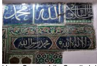
Fotoğraf no: 9 Küre Hoca Şemseddin Camii çinileri bozulmalarından

Kırmızı renkle çatlak olarak belirtilen bazı çiniler kırıktır; belli olan kırık plakalar, aynı numarada harflerle belirtilmiştir (3, 7, 12, 11, 15, 17). Diğer plakalarda belirtilen çatlakların ise bazıları kırık olabilir ama duvara monte olduğu için tespit edilememiştir. (çizim: İrem Çalışıcı Pala, 2017).