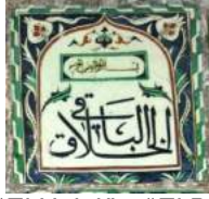
Fotoğraf no: 5 “El Halak” – “El Bakî” Yazılı Pano “El Halak” – “El Bakî” Yazılı Pano: (bakınız çizim: 2, plaka no: 4).

Plaka, 27 x 27.5 cm. olarak ölçülmektedir. Plakada Allah'ın (cc) 99 güzel isminden olan “El Halak”- “El Bakî” yazısı şemse çerçeve içine kobalt mavi ile yazılmıştır. Yazının üstünde iki basit yaprak ve küçük dikdörtgen çerçeve içinde “Bismillahirrahmanirrahim”, şemsenin en ucunun altında küçük rumi kompozisyon bulunmaktadır. Yazının çevresi ile en dışta kullanılan bakır yeşili dolgu ile oluşturulan geçme motifi arası lale ve serbest yaprak motiflerle doldurulmuştur.