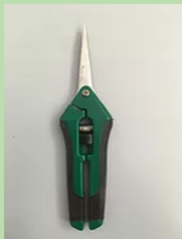
AB406 - FORBICE RACCOLTA ACCAI...