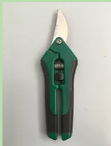
AB405 - RACCOLTA - LAMA PASSAN...