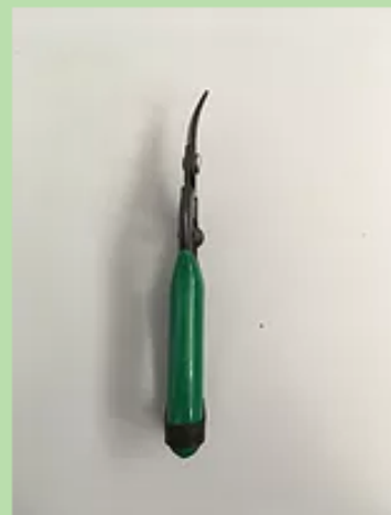
AB440 - FORBICE RACCOLTA LAMA ...