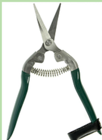
AB300 - FORBICE RACCOLTA PUNT...