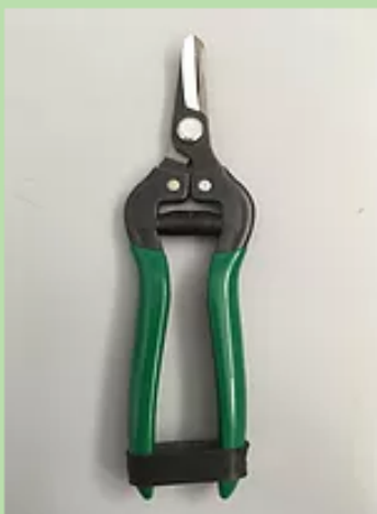
AB430 - FORBICE RACCOLTA LAMA ...