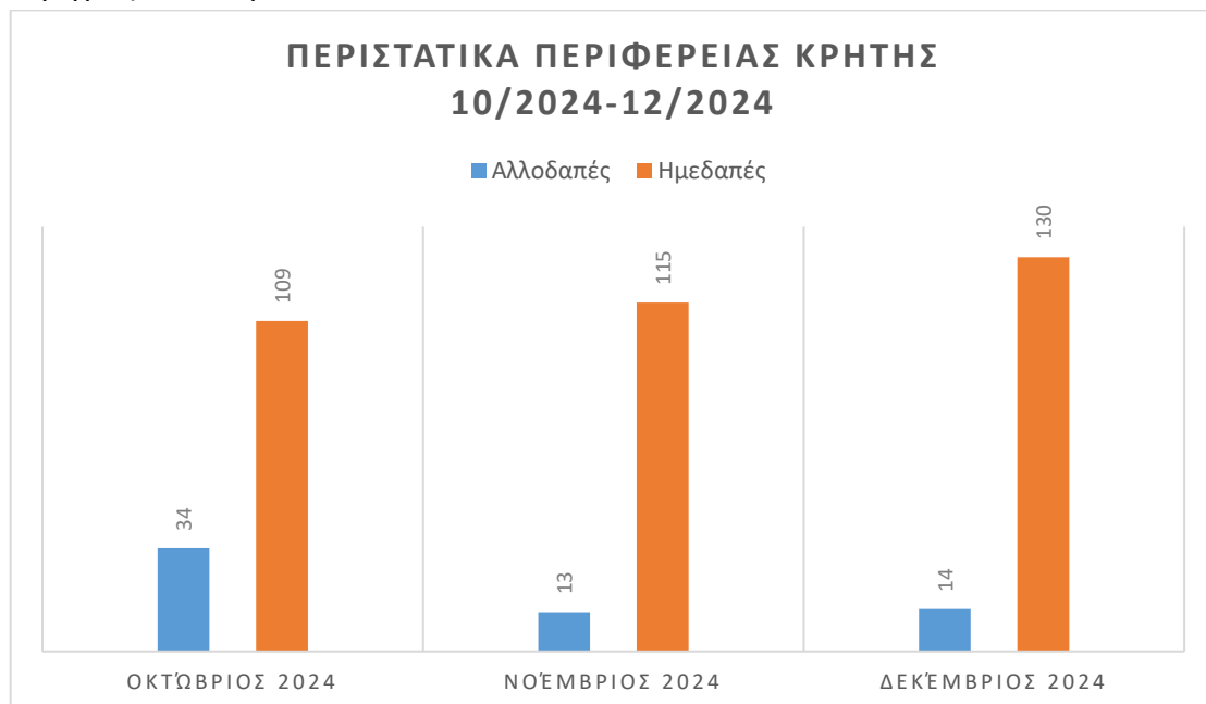
Πίνακας 3

Στην Ελλάδα, και κατ' επέκτασιν στην Κρήτη, η καταγραφή περιστατικών κακοποίησης γυναικών παρουσιάζει αυξητική τάση τα τελευταία χρόνια. Στην Κρήτη, στο διάστημα αναφοράς, καταγράφηκαν περιστατικά κακοποίησης γυναικών, με θύματα τόσο ημεδαπές όσο και αλλοδαπές. Σημαντικό ενδιαφέρον παρουσιάζουν τα στοιχεία αναφορικά με την εθνικότητα-υπηκοότητα των γυναικών-θύματων ενδοοικογενειακής βίας στην Περιφέρεια Κρήτης, όπως περιγράφεται παρακάτω: