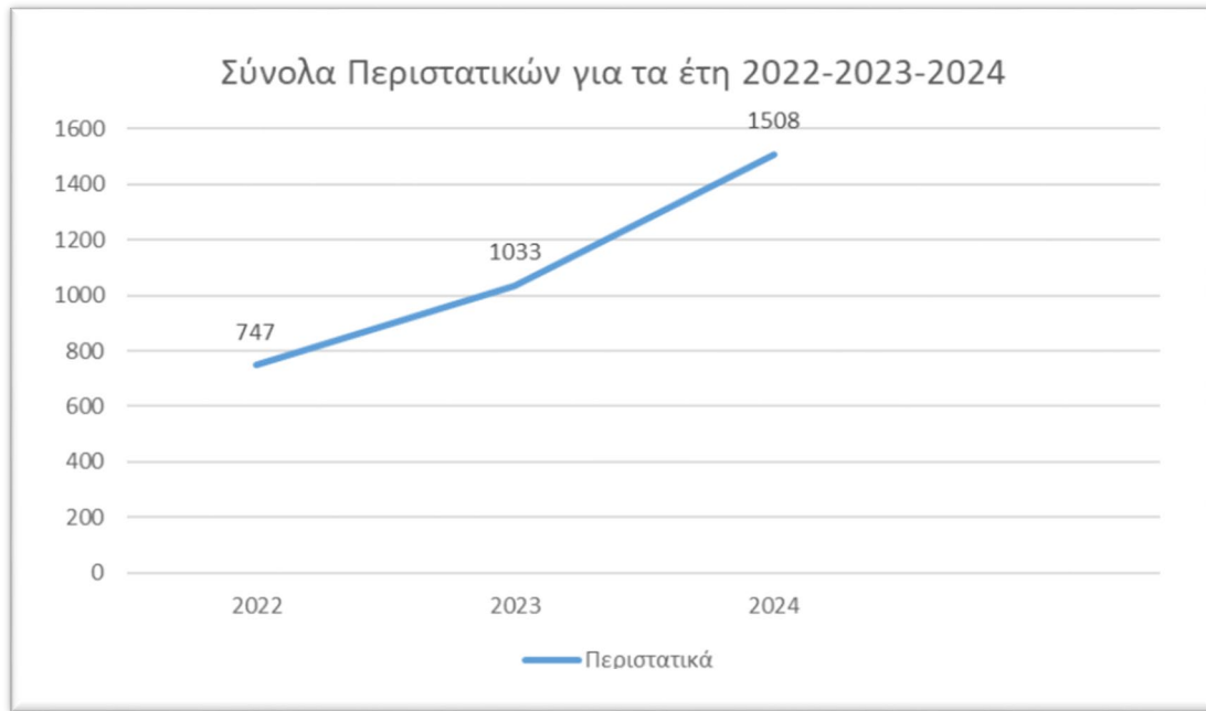
Πίνακας 7

Τα δεδομένα του 2024 είναι σαφώς υψηλότερα από το 2023 και προφανώς τα διπλάσια σε σχέση με το 2022. Εκτιμάται ότι οι καταγγελίες θα αυξηθούν περαιτέρω για το 2025 σε σχέση με προηγούμενα έτη. Αυτή η αύξηση των καταγγελιών αποδίδεται, εν μέρει, στην ενθάρρυνση των θυμάτων να σπάσουν τη σιωπή τους και να αναζητήσουν βοήθεια, καθώς και στην ενισχυμένη ευαισθητοποίηση και τις δράσεις των Αρχών για την αντιμετώπιση του φαινομένου.