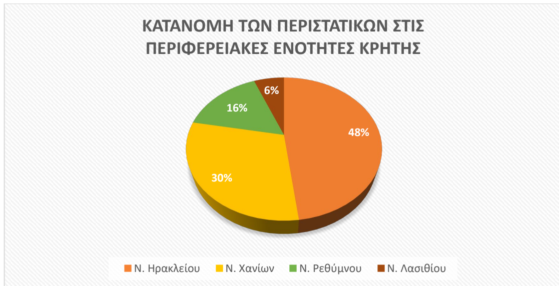
Πίνακας 6 Πηγή: Παρατηρητήριο για τη Βία κατά των Γυναικών στην Κρήτη (2024)

Συνολικά, τα δεδομένα για το 2024 δείχνουν μια σταθερά υψηλή τάση, δείγμα και της πρόθεσης των γυναικών να μιλήσουν και να καταγγείλουν. Η ετοιμότητα των αρμόδιων Τμημάτων Ενδοοικογενειακής Βίας σε όλες πλέον τις μεγάλες πόλεις της Κρήτης (Ηράκλειο, Χανιά, Ρέθυμνο, Άγιος Νικόλαος), απαντά σε αυτήν τη νέα συνθήκη. Παρόλα αυτά, είναι εξαιρετικά σημαντικό οι γυναίκες να μην υπαναχωρούν στις καταγγελίες τους, αλλά και να υπάρχει συντονισμός από τις αρμόδιες Υπηρεσίες πρώτης γραμμής ώστε να μεγιστοποιείται η ασφάλεια τους μετά την καταγγελία.