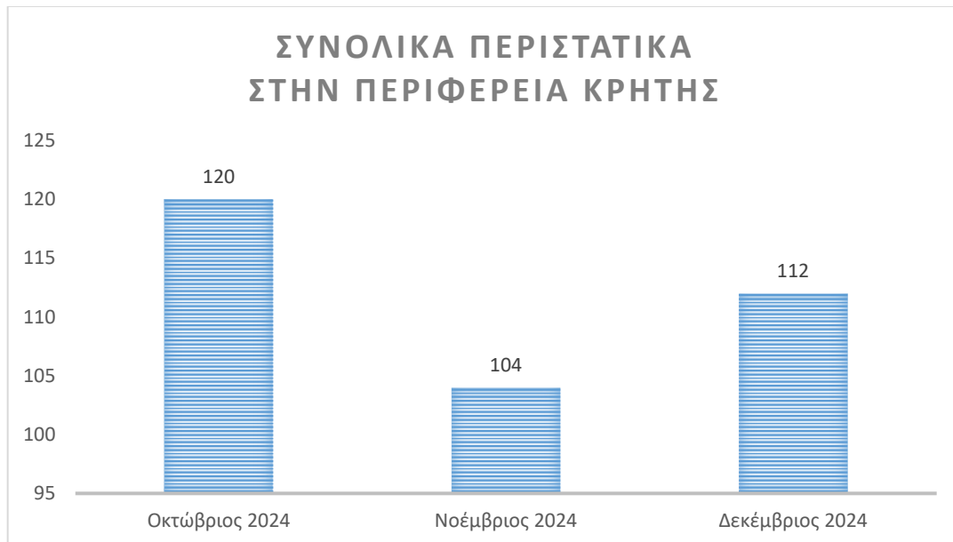
Πίνακας 2

Κατά το διάστημα αναφοράς προκύπτει ότι κατά μέσο όρο στην Κρήτη γίνονται 112 καταγγελίες περιστατικών ενδοοικογενειακής βίας ανά μήνα ή αλλιώς, 4 καταγγελίες ανά ημέρα. Κατά το ίδιο χρονικό διάστημα δεν καταγράφηκε γυναικοκτονία στο νησί.