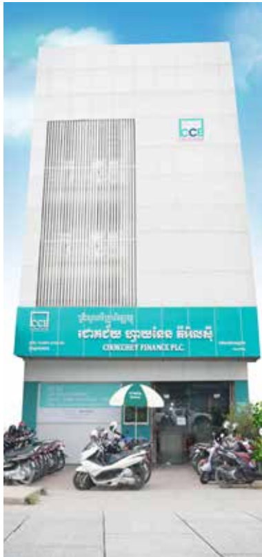
ការិយាល័យកណ្តាល