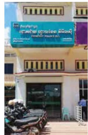
សាខាជើងព្រៃ (CHP)