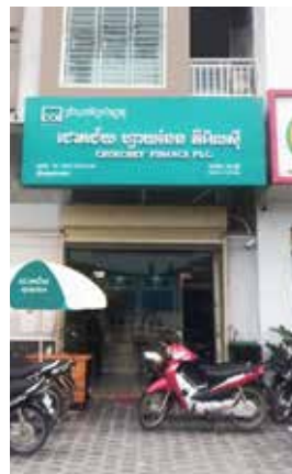
សាខាតាខ្មៅ (TKH)