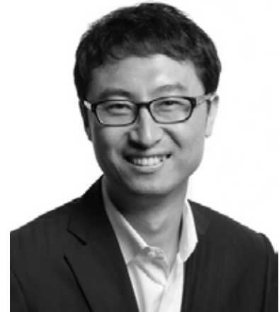
លោក CHEON GIL PARK អភិបាល