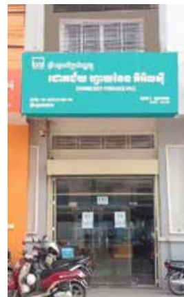
សាខាទួលគោក (TK)