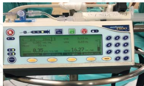
Figura 3B: Sistema de perfusión Medfusion 3500 .