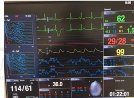
Figura 5: Monitoreo en primer tiempo quirúrgico.