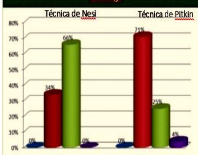
Grafica 2. Escala de Bromage a los 15 minutos.

La latencia del BE entendiendo como el tiempo en minutos desde que se aplica el AL hasta su inicio de acción en minutos, para iniciar la cirugía. Con la técnica