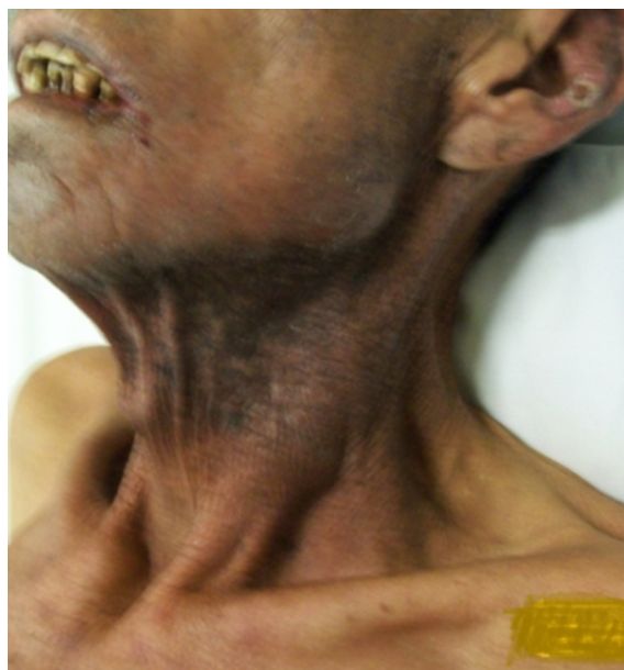
Figura 1. Vía aérea difícil en un paciente con tumor de lengua y secuelas de radiación.

El US representa una herramienta de gran utilidad para la valoración de la vía aérea, en pacientes con compromiso de la misma, nos permite una visualización directa en tiempo real de las estructuras anatómicas, por lo tanto es útil para la planificación de una estrategia adecuada en la intubación orotraqueal.