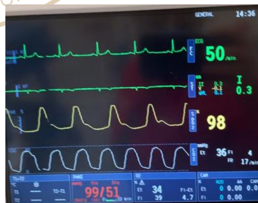
Figura 2: El \text{CO}_2 en ventilación espontánea

Considerando que en la gran mayoría de los casos de cirugía plástica el cirujano infiltra el área quirúrgica deberemos de pensar en un procedimiento anestésico que no sea tan invasivo como en el caso de una anestesia general (intubación), pero que permita trabajar al cirujano cualquier área del cuerpo y sobre todo si hablamos de procedimientos de mínima invasión, como en el caso de una blefaroplastia (por ejemplo), creo que es la técnica ideal para estas cirugías, pues la mayor concentración del fármaco se realizara solo mientras el cirujano realice la infiltración del anestésico local, y una vez infiltrado, nos permite bajar las concentraciones de los fármacos, y mantener las concentraciones lo más pegado al piso del rango terapéutico y con eso realizar despertares lo más parecidos a lo fisiológico y con el mínimo de efectos secundarios. Y en otro tipo de procedimientos como en el caso de ritidectomias en donde las mayores complicaciones se presentan a la hora de la extubación por el esfuerzo tan grande que realizan al toser, (en muchas de las veces) lo que condiciona la posibilidad de hematomas en cara, considero la sedación es también una buena opción, sin olvidar los principios del monitoreo en todas las anestесias pero sobre todo en el caso de la sedación tanto el monitoreo cerebral como el caso de \text{CO}_2 que resultan imprescindibles. (Figura 2 y 3).