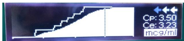
Fig. 1. Titulación de propofol .

No olvidar que de acuerdo a los perfiles de cada fármaco éste es el orden de recomendación para perfundir opioides en primer lugar remifentanilo y en segundo lugar sufentanilo y en último lugar (pero es el opioide existente en todos los medios) fentanilo , sin olvidar de éste la alta liposolubilidad lo cual le confiere la posibilidad de acumularse con el tiempo de la perfusión de ahí que debemos de considerar la vida media sensible al contexto de cada opioide, pero del fentanilo en especial. No es el ideal.