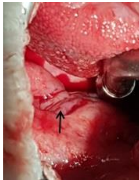
Imagen 1: Lesión de pilar amigdalino derecho.

200 µg, rocuronio 30 mg, propofol 110 mg. Latencia de cinco minutos. Se realiza intubación utilizando VL "vividtrac" para adultos. Se realiza colocación de tubo oro-traqueal , con diámetro interno de número siete a través de dispositivo realizando maniobra al primer intento. Sin embargo, al retirar dispositivo de cavidad oral, se observa sangre en extremo distal de la pala. Se informa al departamento de otorrinolaringología; se verifica sangrado siendo el cual no es profuso; una vez terminada la cirugía se coloca abrebocas tipo Mc Ivor , donde se valora lesión lineal de 1.5 cm aproximadamente en el pilar amigdalino derecho; sin afectación profunda, muscular o de alguna otra estructura; únicamente se aplica hemostasia bajo presión directa. (Imagen 1 y 2). Cirugía llevada a cabo satisfactoriamente, sangrado de 50 cc, se retira el tubo traqueal sin otro incidente o accidente. En evento post-quirúrgico, se evalúa paciente, la cual únicamente refiere dolor retrofaringeo de leve intensidad, Escala Numérica Análoga 3/10, sin presencia de sangrado, alteración en deglución o sangrado. Se otorga alta hospitalaria a las 24 horas.