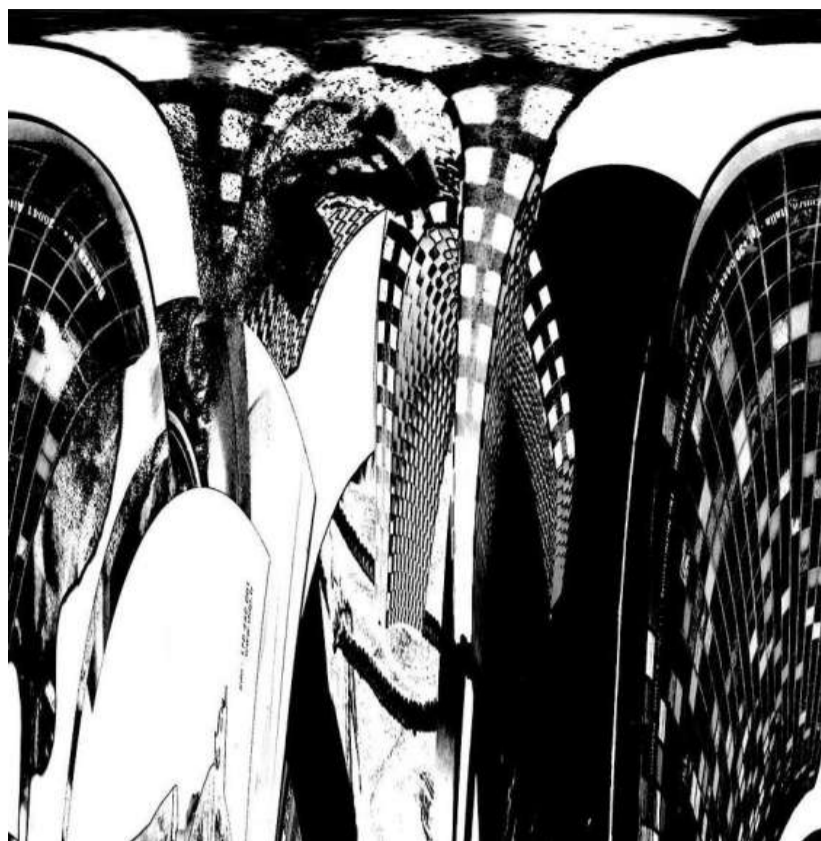
Links: 'Pakhuis Herinnering' van Rob de Heer, rechts: 'Veiled' van Katrin Cassel.