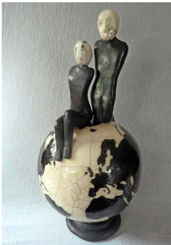
Keramiek van Carla van Dam.