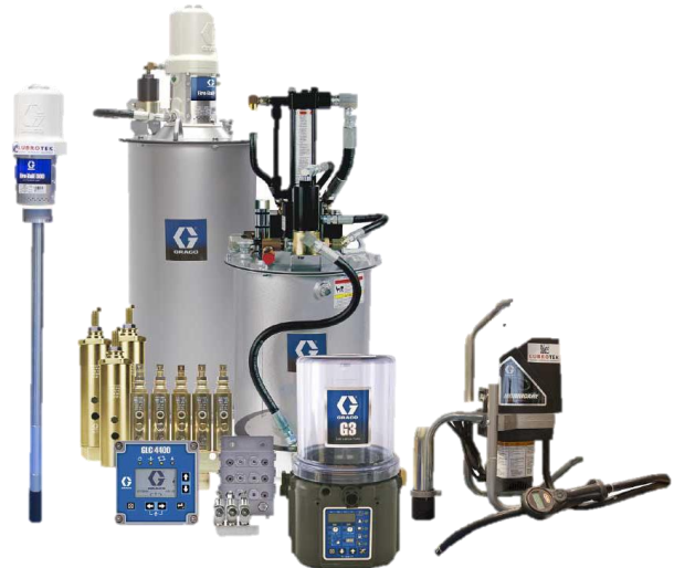
Sistema de Lubricación Automático