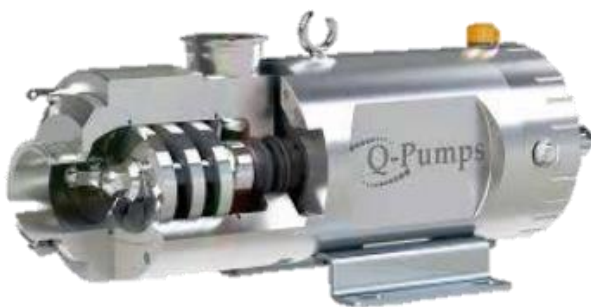
Bomba de Doble Tornillo