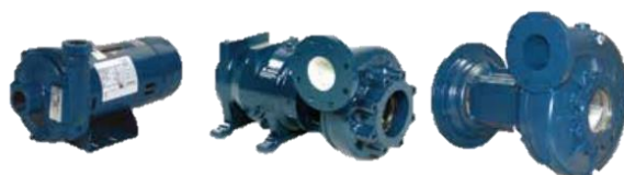
Bombas Horizontales Centrifugas