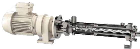
Bomba Tornillo Excéntrico