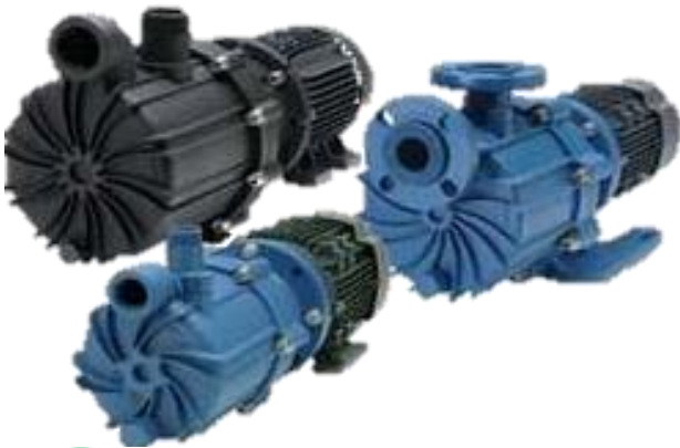
Bombas de Acoplamiento Magnético