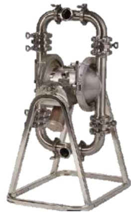
Bomba Doble Diafragma