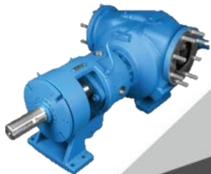
Bombas de Engrane