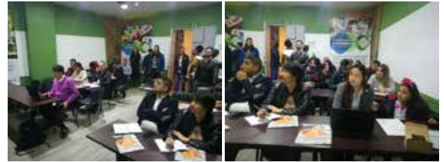
El programa consta de 7 fases donde se desarrolla una metodología de PML y se obtienen resultados concretos