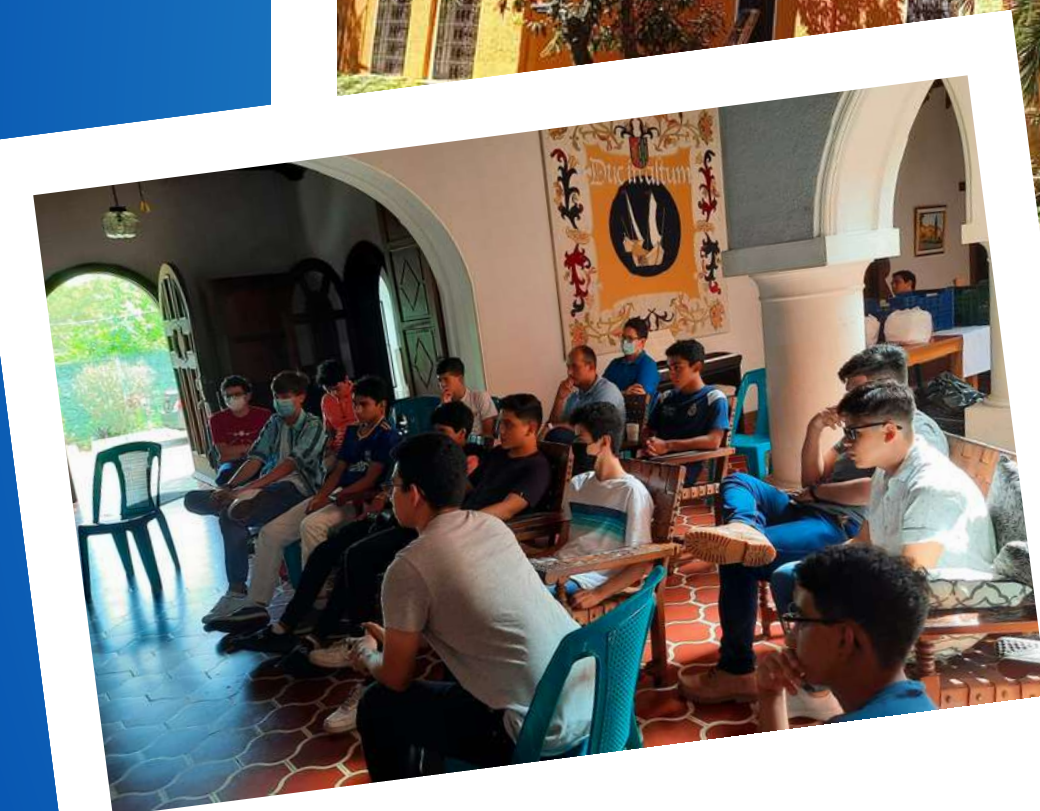
The Grade 2022