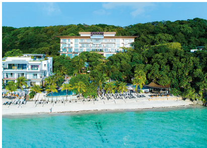
Hotel Kimpton Roatán Tipo de Cable: THHN/THWN