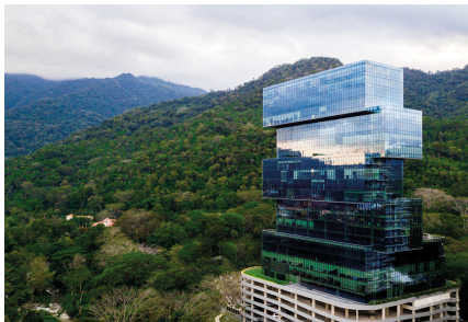
Nuevos Horizontes Business Center Tipo de Cable: THHN/THWN / XLPE CU