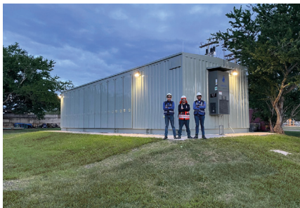
Repair Primary Grid, Base Soto Cano. Tipo de Cable: THHN/THWN / EPR CU (4.5 km)