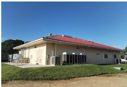
Hospital Regional Materno de Puerto Lempira Tipo de Cable: THHN/THWN