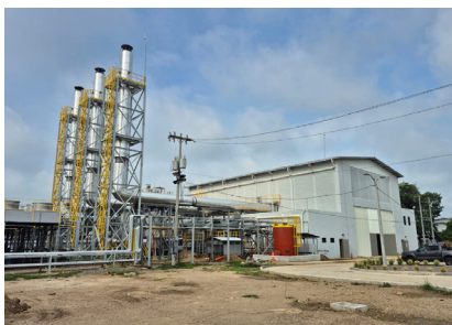
Planta Térmica Park Energy (27 MW) Tipo de Cable: XLPE/CU en Media Tensión.