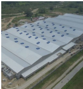
Planta San Juan Textiles Tipo de Cable: THHN/THWN / XLPE CU