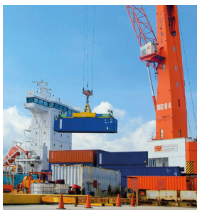
Operadora Portuaria Centroamericana (OPC) Tipo de Cable: THHN/THWN / EPR, AL