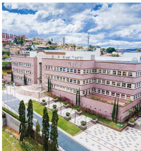
Banco Centroamericano de Integración Económica (BCIE), Anexo Tipo de Cable: THHN/THWN / XLPE CU