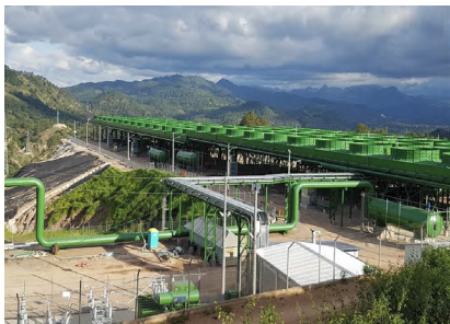
Planta Geotérmica Geoplatanares 44 MW. Tipo de Cable: ACSR Aluminio para LT en 69 kV (27 km).