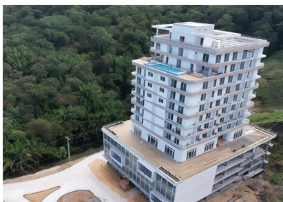
DUNA Tower Residences Tipo de Cable: THHN/THWN / XLPE CU