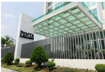
Torre Penta Condominios Tipo de Cable: THHN/THWN / XLPE CU