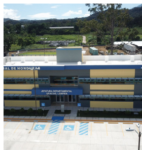
Jefatura de Policía Gracias, Lempira Tipo de Cable: THHN/THWN