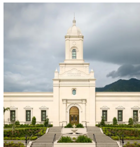
Templo IJSUD de San Pedro Sula Tipo de Cable: THHN/THWN / XLPE CU