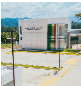
Macro Distrito de Salud Cofradía Tipo de Cable: THHN/THWN