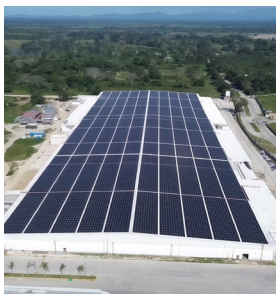
Planta Parkdale Greenfield Tipo de Cable: THHN/THWN