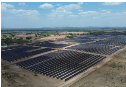
EPC Planta Solar ENACAL 18 MWp. Tipo de Cable: Cable de cobre desnudo #4/0 AWG para Red de Tierra