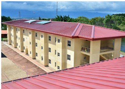
Barracks FY-19, Base Soto Cano Tipo de Cable: THHN/THWN / XLPE CU