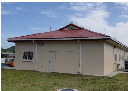
Emergency Operation Center / Disaster Relieve Warehouse, San Lorenzo, Valle Tipo de Cable: THHN/THWN