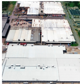
Planta de Hilatura CK Tipo de Cable: THHN/THWN / XLPE CU