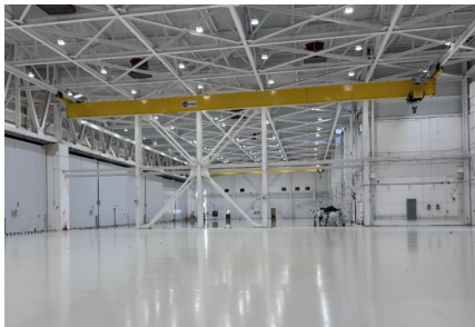
Aircraft Maintenance Hangar, Base Soto Cano Tipo de Cable: THHN/THWN, RHW / EPR, CU