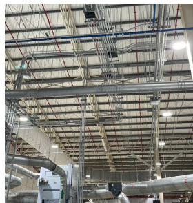
Planta Parkdale ACME Tipo de Cable: THHN/THWN / XLPE CU