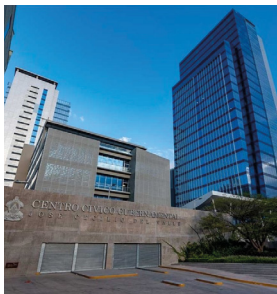
Centro Cívico Gubernamental (CCG) Tipo de Cable: THHN/THWN / XLPE CU (1,700 km)