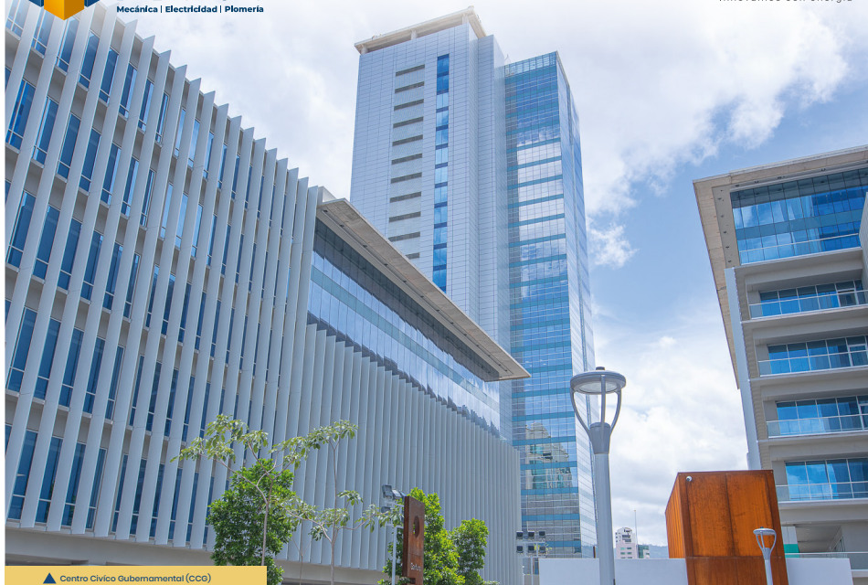
▲ Centro Cívico Gubernamental (CCG)