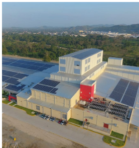
Planta de Hilatura UTEXA Tipo de Cable: THHN/THWN / XLPE CU