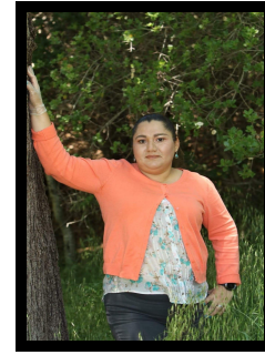
Presidenta de ELAC, Marlyn Lemus

https://zoom.us/j/4072918039?pwd=bFRtY2cxVlZDUTgxOU11NGJXZU