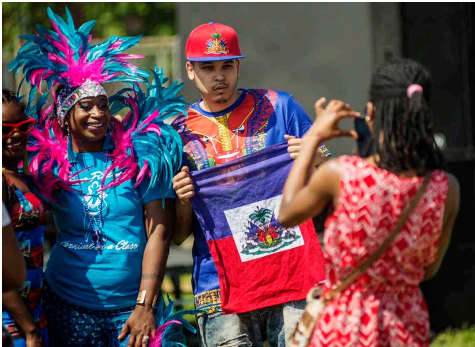
La colorida bandera haitiana es un ancla importante para la cohesión comunitaria.