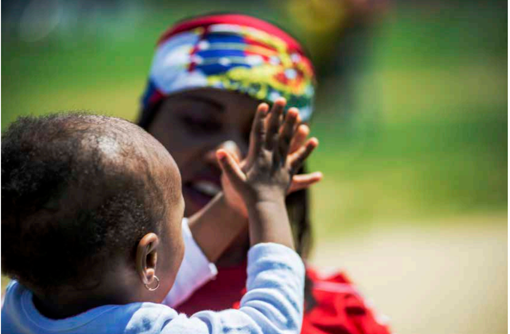
ARRIBA: Una mujer haitiano-estadounidense celebra el Día de la Bandera de la comunidad con su hijo.

El tejido cultural de Filadelfia, volumen dos.