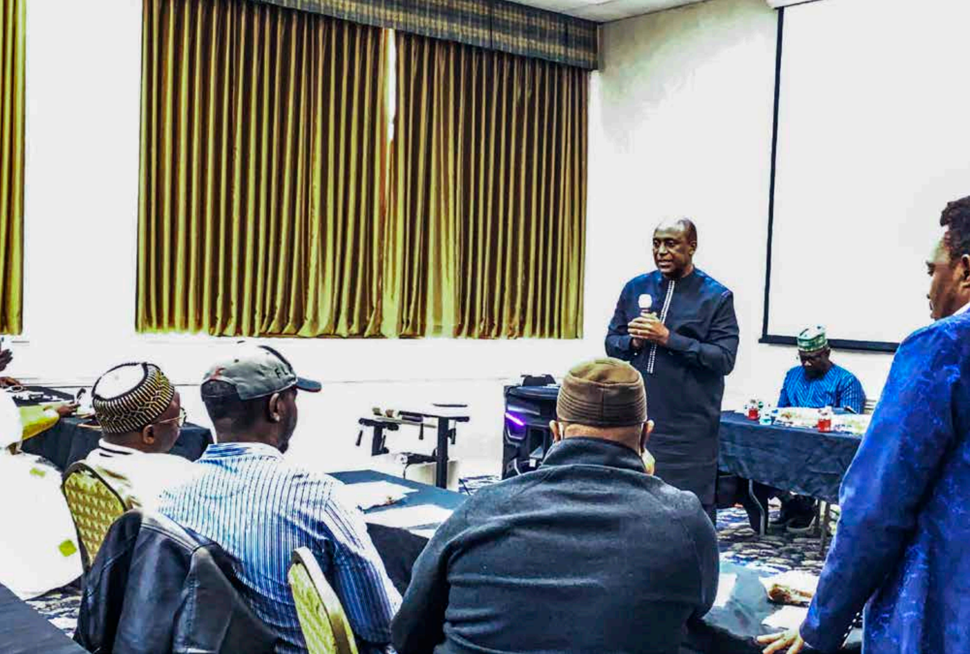
El Dr. Kandeh Yumkella visita Filadelfia como parte de una visita más amplia a la diáspora de Sierra Leona en el este de los Estados Unidos. Miembro del Parlamento de Sierra Leona, busca compartir temas de importanciap para Sierra Leona y sus pueblos dispersos.