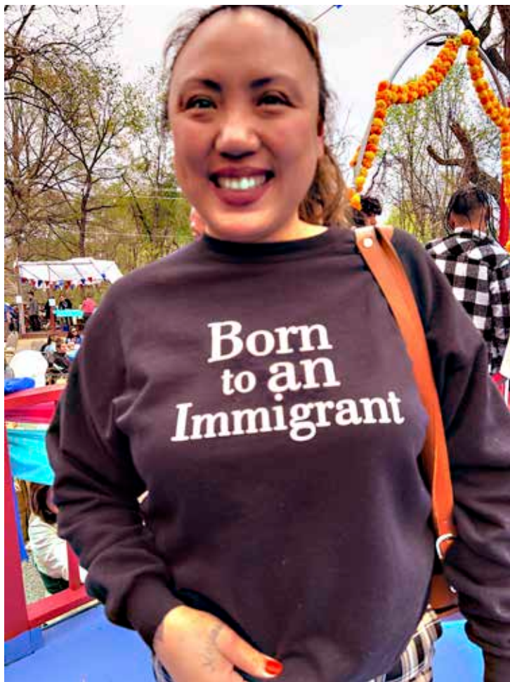
Un juguista de Año Nuevo de Laos fuera del templo budista de Chew Street.