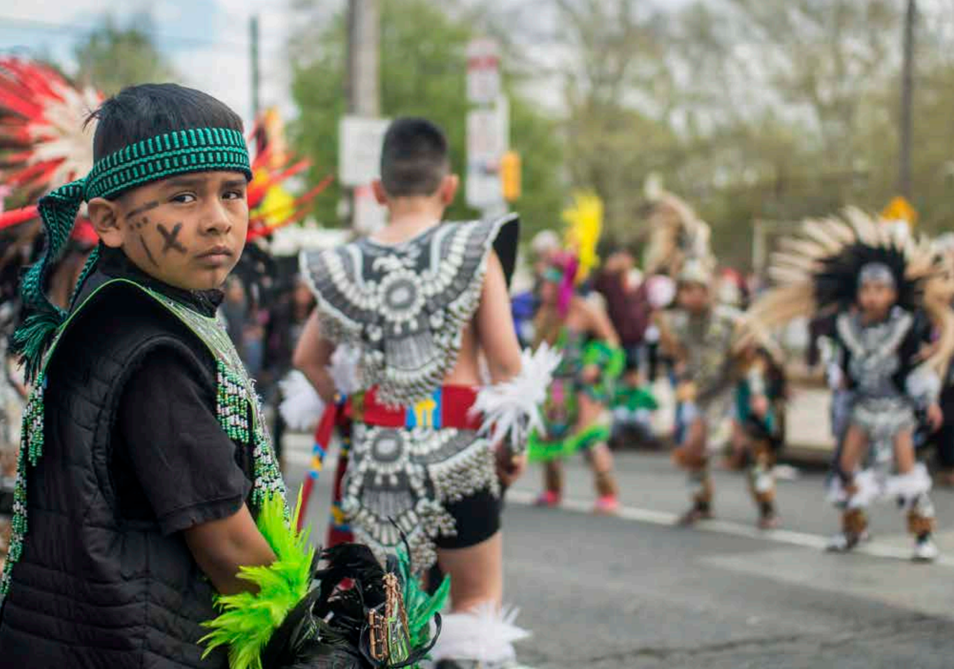
ARRIBA: Un joven mexicano en medio del colorido y el boato del desfile de El Carnaval de Puebla. Procesando por la avenida Washington hasta el Sacks Playground en la esquina de la calle 5, esta celebración anual de la cultura mexicana atrae a miles de personas.