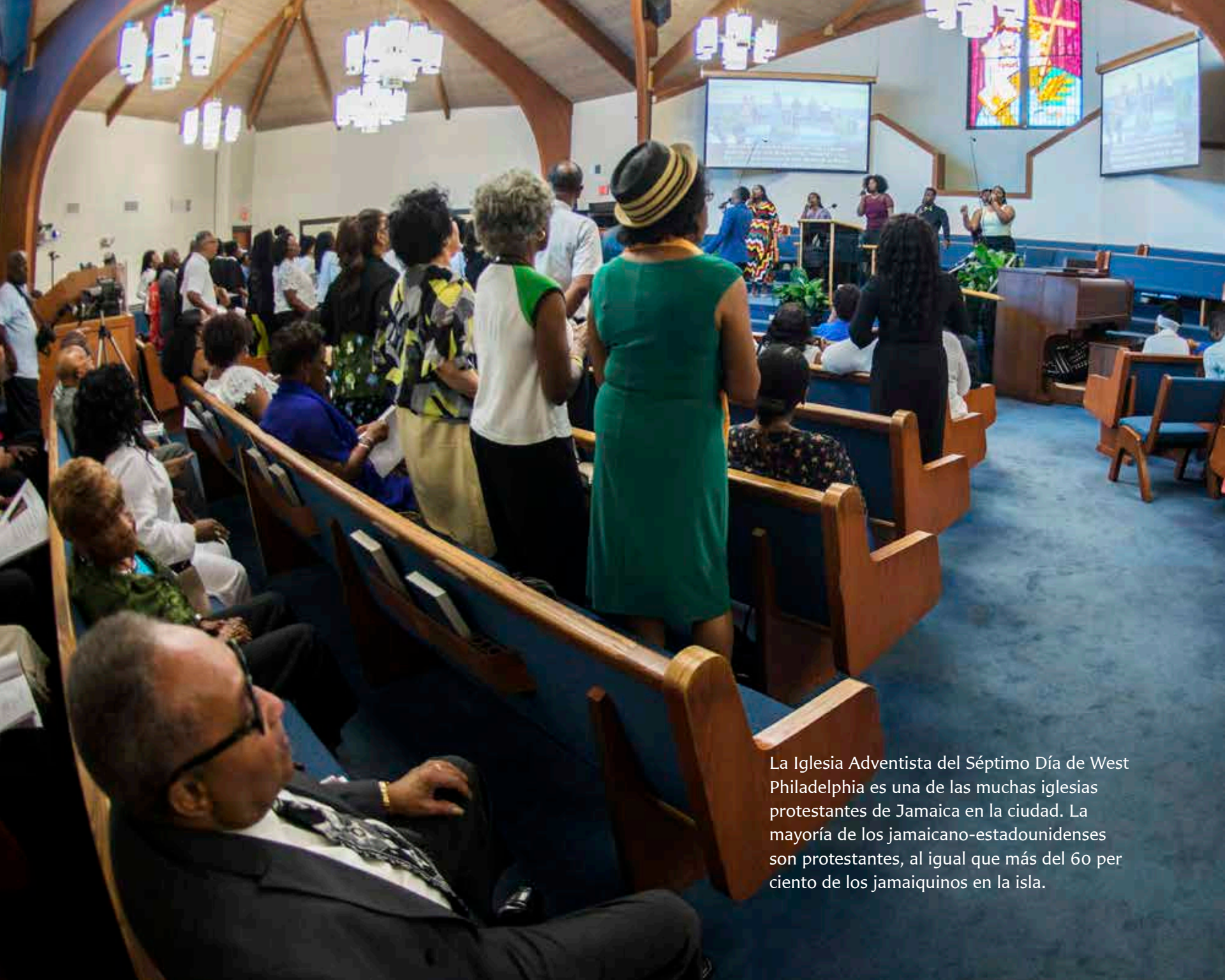
La Iglesia Adventista del Séptimo Día de West Philadelphia es una de las muchas iglesias protestantes de Jamaica en la ciudad. La mayoría de los jamaicano-estadounidenses son protestantes, al igual que más del 60 por ciento de los jamaquinos en la isla.