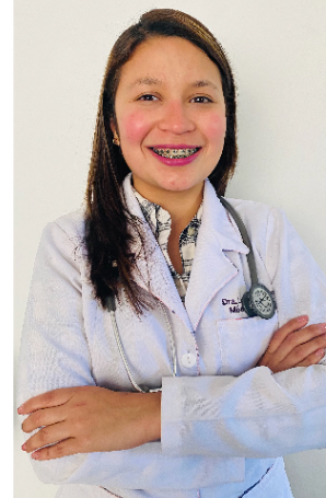
Por: Dra. Laura Graterol

A nivel mundial, aproximadamente el 5 de cada 100.000 trabajadores experimentan neuropatía del túnel carpiano, asociado a edades entre 30-60 años, más común en mujeres y en profesiones que implican trabajos manuales repetitivos, traumatismos o sobrepeso. Desde una perspectiva anatómica, el túnel carpiano es una estructura en la parte anterior y flexora de la muñeca, a través de la cual pasan los tendones y el nervio mediano, uno de los nervios principales de la mano. Este nervio está relacionado con la flexión y la sensibilidad de los tres dedos iniciales de la mano. La compresión de esta estructura debido a la inflamación del conducto puede limitar la circulación sanguínea en la mano y causar estimulación del nervio mediano.