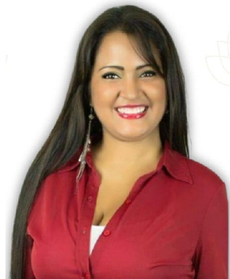
Por: Dra. Carbery Mitchell