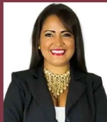
Por: Carbery Mitchell

La estructura de nuestro evento estará dividida por ponencias, charlas y paneles inspirados en el potencial turístico de esta Isla caribeña, destacada por ser premiada como la primera en el mundo en recuperación turística por la Organización Mundial del Turismo (OMT).