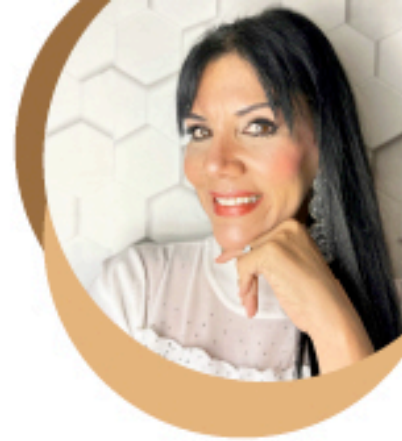
Por: Mariana Chiza

La manera de perder el miedo es comenzar a ordenar tu vida para que todo esfuerzo tenga resultados. Lo importante es que estés convencido de hacerlo, busca ayuda, para eso están los libros, el internet y pídele consejo a un profesional que sepas que te va a guiar en tu proceso de aprendizaje. Pon todos tus conocimientos en marcha, si bien, el miedo a emprender algo nuevo es grande, es peor aún no hacer nada y quedarte sin llevar a cabo tus sueños. Determinate a salir de tu 'zona de confort' y construye sin temor lo que tanto deseas, ya que nadie lo hará por ti. Encuentra en tu vida tu propósito y lo que te apasiona, porque el Éxito de cada ser humano que está dispuesto a superarse se logra confrontando a todos los fantasmas que muchas veces solo están en su mente, así conseguirás lo que deseas hacer y crearás la vida que deseas vivir.