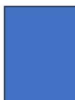
1 page 7,5" x 10" 300 $