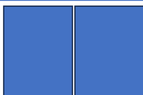
2 pages du centre 1 page (7,5" x 10") = 350 $ 2 pages (15" x 10") = 650 $

Pour une meilleure visibilité, premier arrivé, premier servi!