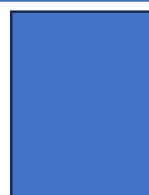
Couverture arrière 7,5" x 10" 1000 $