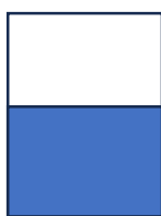
½ page 7,5" x 5" 200 $