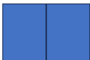
2 pages côte à côte 15" x 10" 500 $