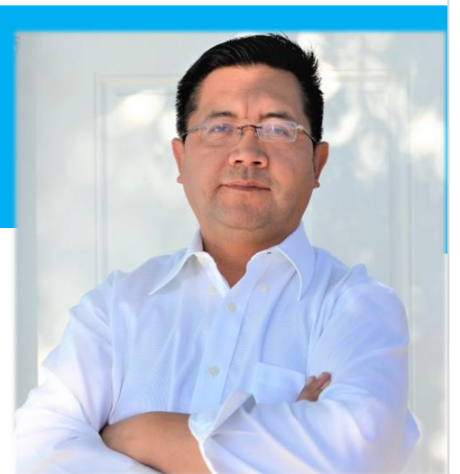
Por: William Delgado Gil @WilliamDelgadoG

“Pues yo sé los planes que tengo para ustedes—dice el Señor—. Son planes para lo bueno y no para lo malo, para darles un futuro y una esperanza”. Jeremías 29:11