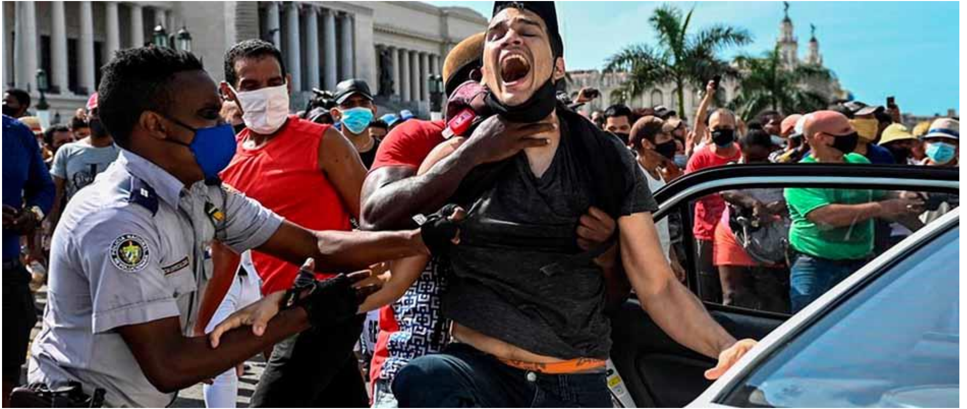
Las manifestaciones del 11J fueron un detonante de la persecución contra cristianos en Cuba